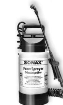
04964410 Foamsprayer 3 l