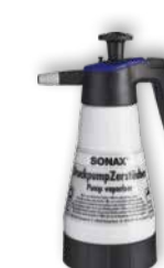
04969410 DruckpumpZerstäuber für saure/alkalische Produkte