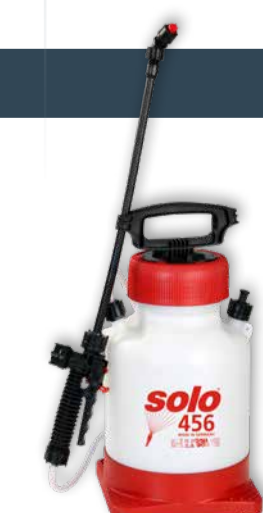
04960000 Niederdruck Sprühgerät 5 l