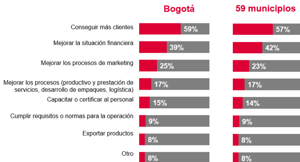
Gráfica 1. Necesidades de las empresas en el 2023

Los resultados de la Gran Encuesta del Empresariado y la Economía Popular son congruentes con un diagnóstico que muestra un nivel de escala productiva limitado para un conjunto importante de los negocios de la capital y la región: el 50% de las empresas de Bogotá no tiene más de 5 años (59% en Cundinamarca), el 56% tiene 3 o menos empleados (66% en Cundinamarca), el 37% no hace aportes a salud (51% en Cundinamarca), el 30% entra en mora con sus deudas (28% en Cundinamarca), el 25% no lleva contabilidad (40% en Cundinamarca), entre otras.