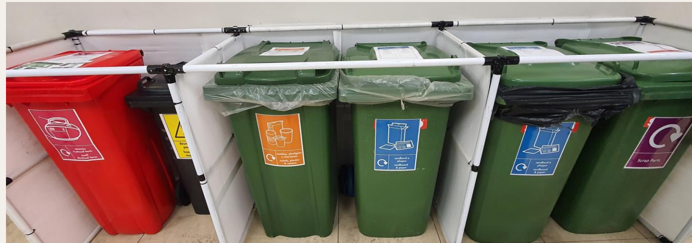
[Darluniau] Bin gwastraff bwyd ar wahân a biniau â chod lliw ar gyfer pob ffrwd ailgylchu