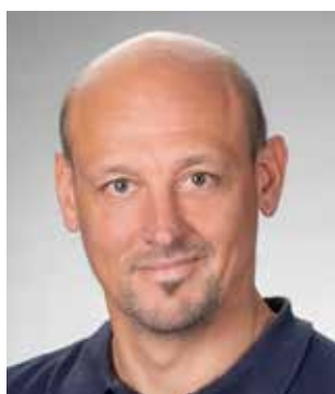
Christian Futterknecht Anwendungstechnik Steildach