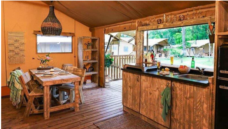
Bildunterschrift: Erlebe einen idyllischen Urlaub in unserem EuroParcs Zilverstrand mit komfortablen Safarizelten.