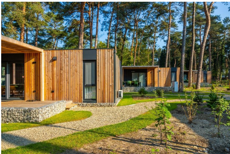
Bildunterschrift: Egal ob Camping oder modern ausgestattetes Ferienhaus – Unsere Ferienparks bieten vielfältige Unterkünfte für jeden Geschmack an.

Weitere Ferienparks in der Natur findest du hier . Bis zum 13. Oktober 2023 kannst du unseren