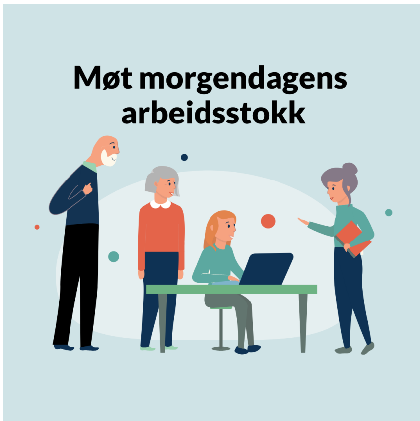
Bevisstgjøringskampanje: Morgendagens arbeidsstokk