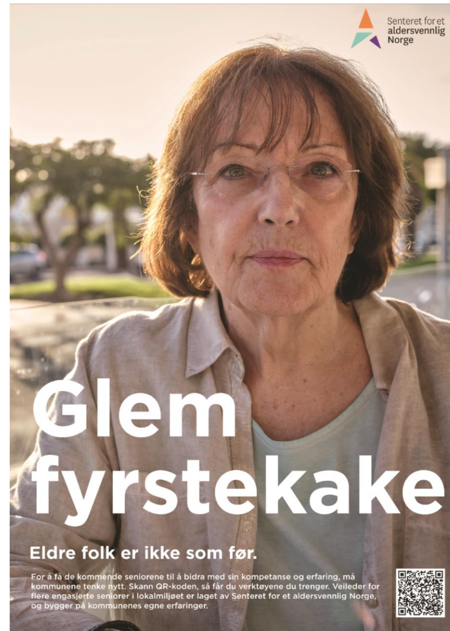
Veileder for flere engasjerte seniorer i lokalmiljøet