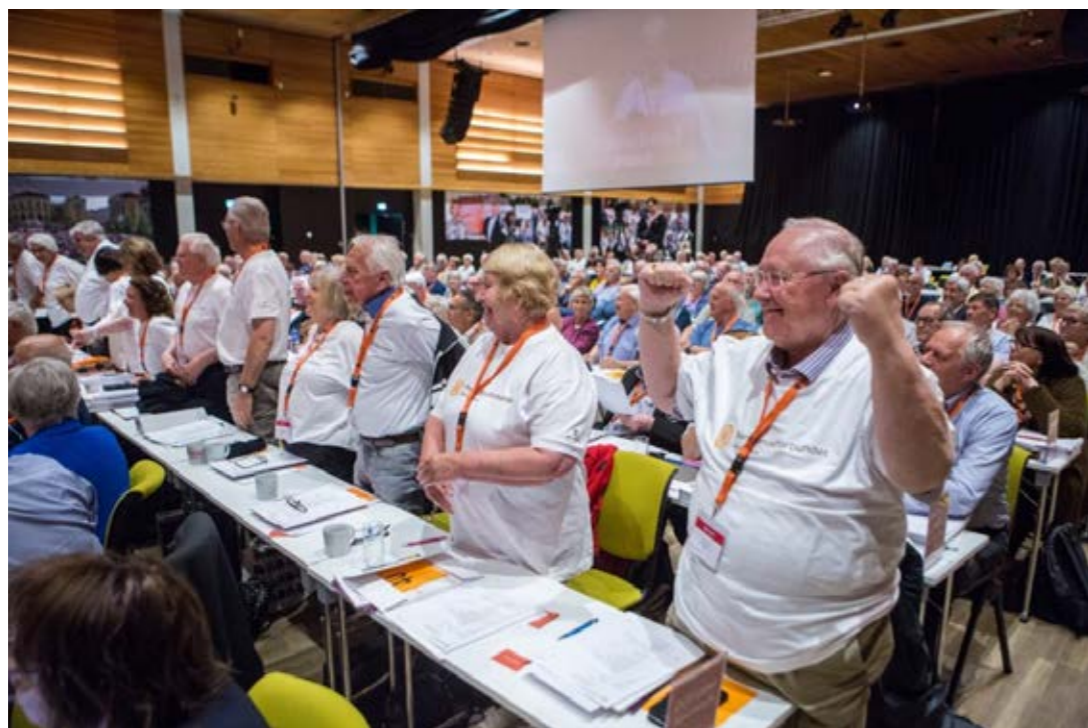
AKERSHUS-BENKEN under landsmøtet – i egne landsmøte-trøyer!