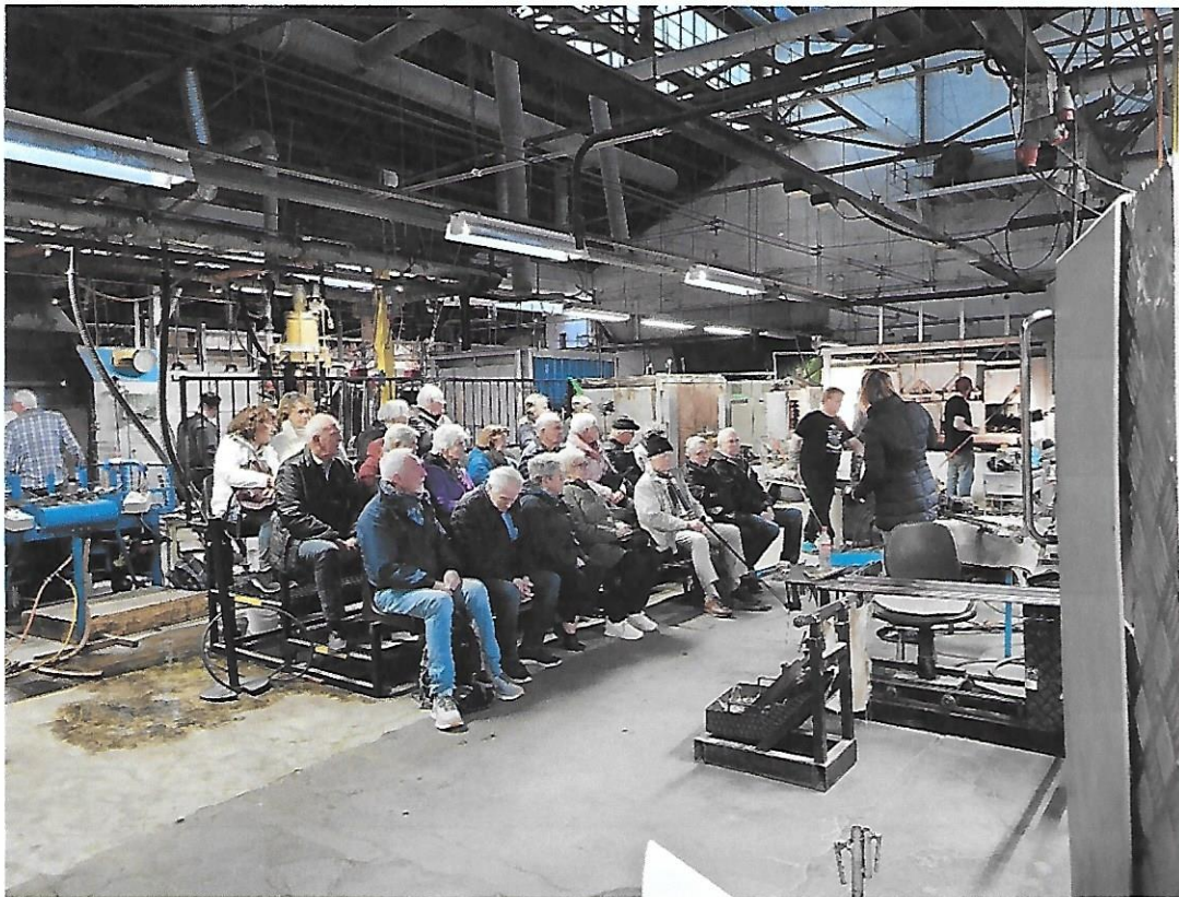
Fredrikstads pensjonister på besøk hos Hadeland Glassverk

Mandag 27. februar kl. 1800 +Huset, Holmen