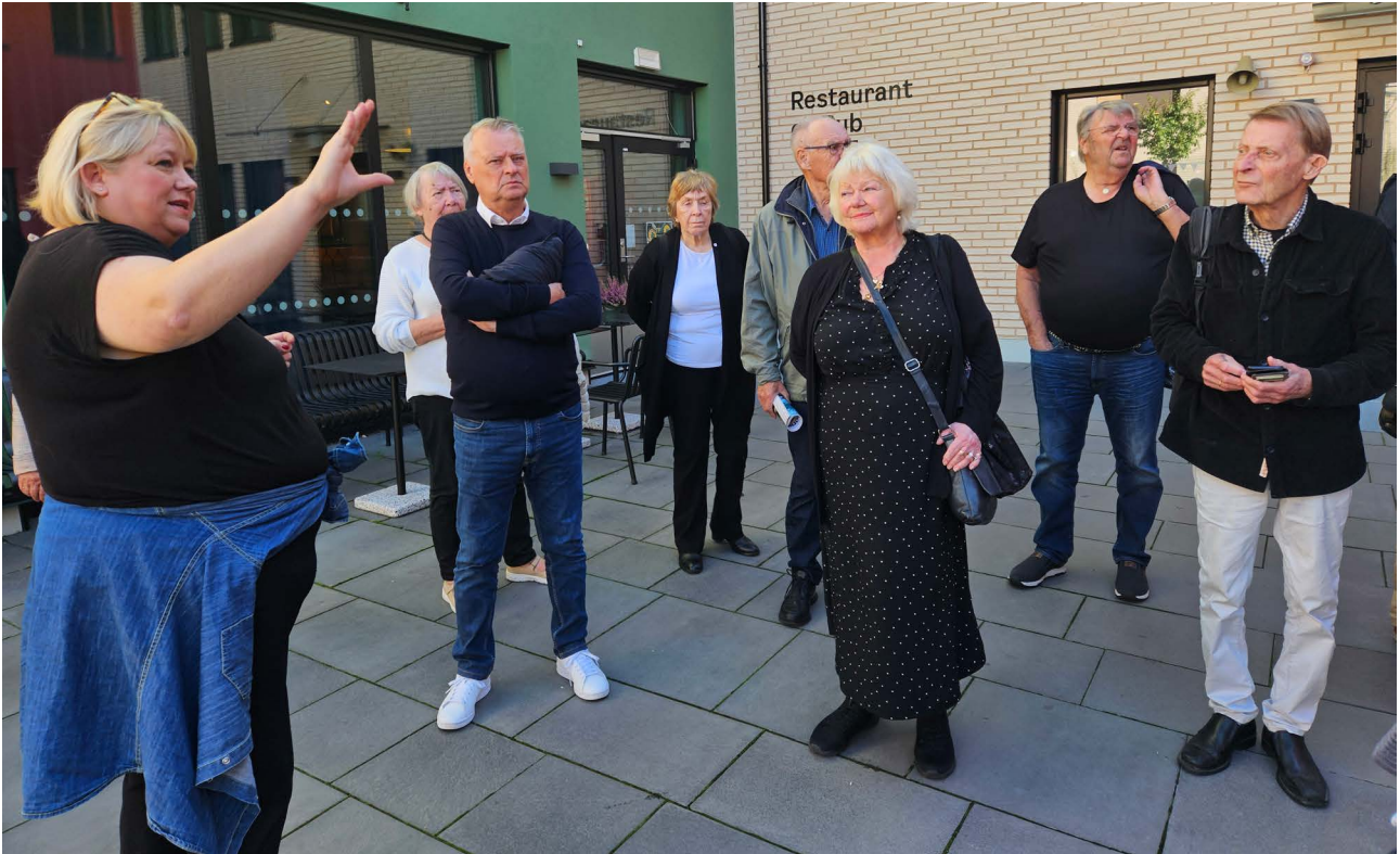
Pensjonistforbundet var vertskap for NSKs årsmøte, og tok deltakerne med på et besøk til Dronning Ingrid's hage, et unikt bokonsept i Oslo for personer med demens.