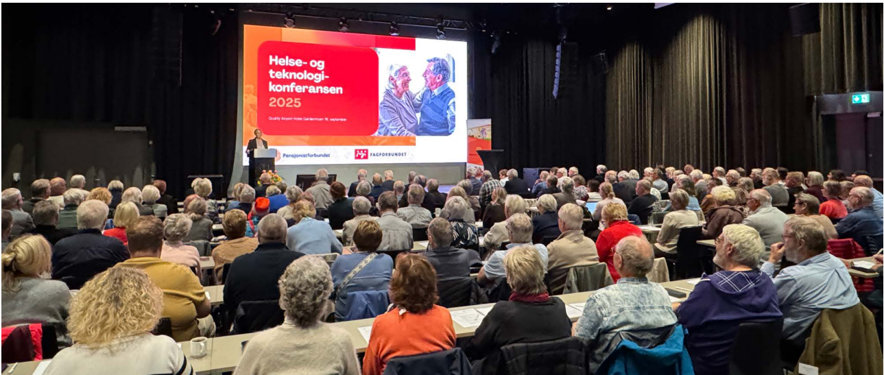
Helse- og teknologikonferansen trakk mange tilhørere rundt aktuelle problemstillinger.

følge med på den faglige utviklingen og kvaliteten ute i tjenestene. Vi vil bidra med brukerstemmen, komme med anbefalinger og svare på høringer og andre henvendelser som krever denne kompetansen.