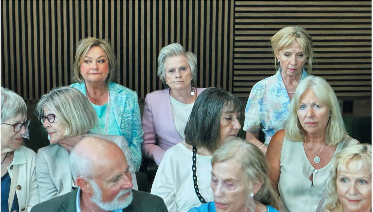
Pensjonistforbundet deltok med et femtittalls statister til innspillingen av den nye norske filmen "Pensjonskuppet", som kommer på kino høsten 2026.