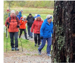
Stavgang rundt Åsskardfjorden

Inviterer til kaffe og pølsegrilling i Skarsåsen