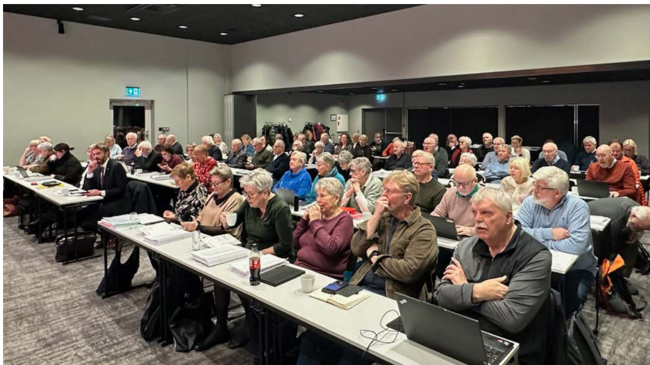
Landsstyret er Pensjonistforbundets høyeste myndighet mellom landsmøtene, og møtes fire ganger i året.