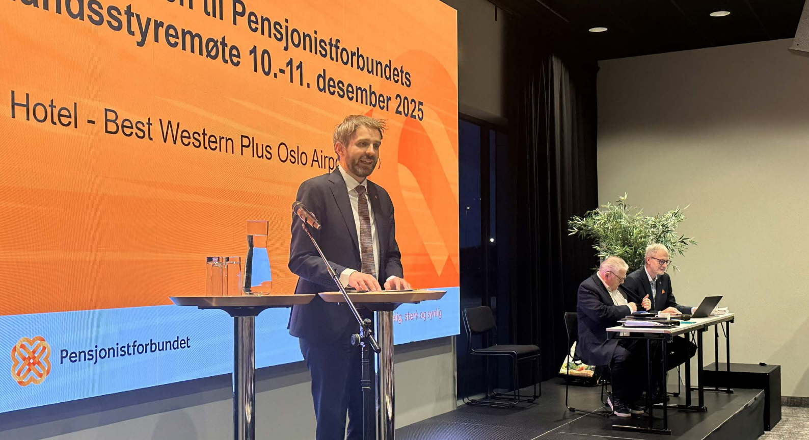
Helse- og omsorgsminister Jan Christian Vestre (Ap) ble invitert til landsstyremøtet i desember.