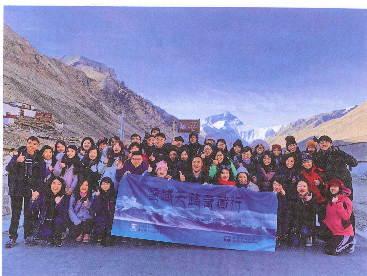
▲交流的最終目的就是分享異見、和而不同。圖為香港大學生在甘肅、青藏交流。