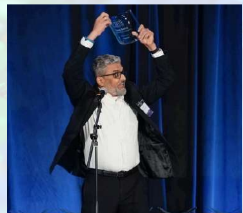
Dallas Business Journal Top-30 'C Suite Leader' Award 2025