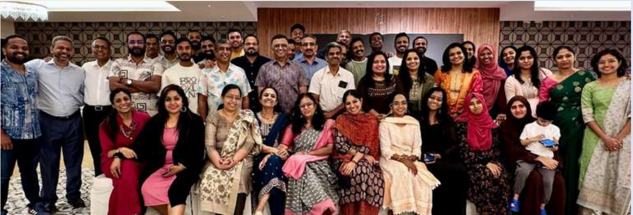
Oman Chapter Eid get together on 9th march 2026 at Native story.