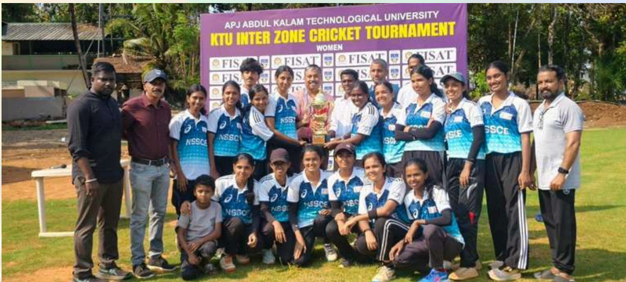
FISAT - അങ്കമാലിയിൽ വെച്ചു നടന്ന പ്രഥമ സാങ്കേതിക സർവകലാശാല ഇന്റർസോൺ വനിതാ ക്രിക്കറ്റ് ചാമ്പ്യൻഷിപ്പ് NSSCE യുടെ പെൺകുട്ടികൾ കരസ്ഥമാക്കിയിരിക്കുന്നു.