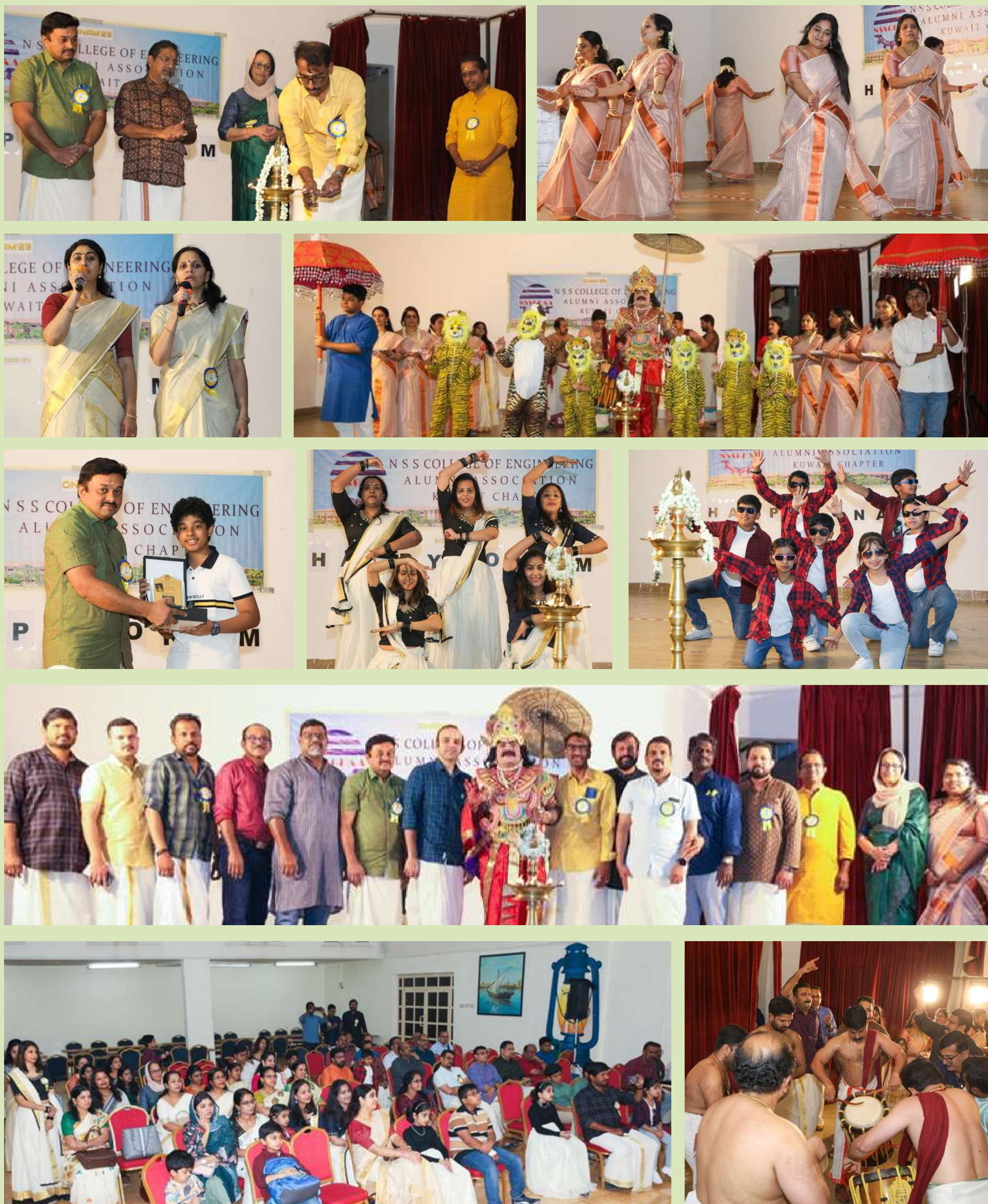
Alumni association Kuwait chapter organized onam celebrations “ONAM DRISHYAM 2023” held at Pakistani Oxford School, Jleeb, Kuwait on 22nd September, 2023.