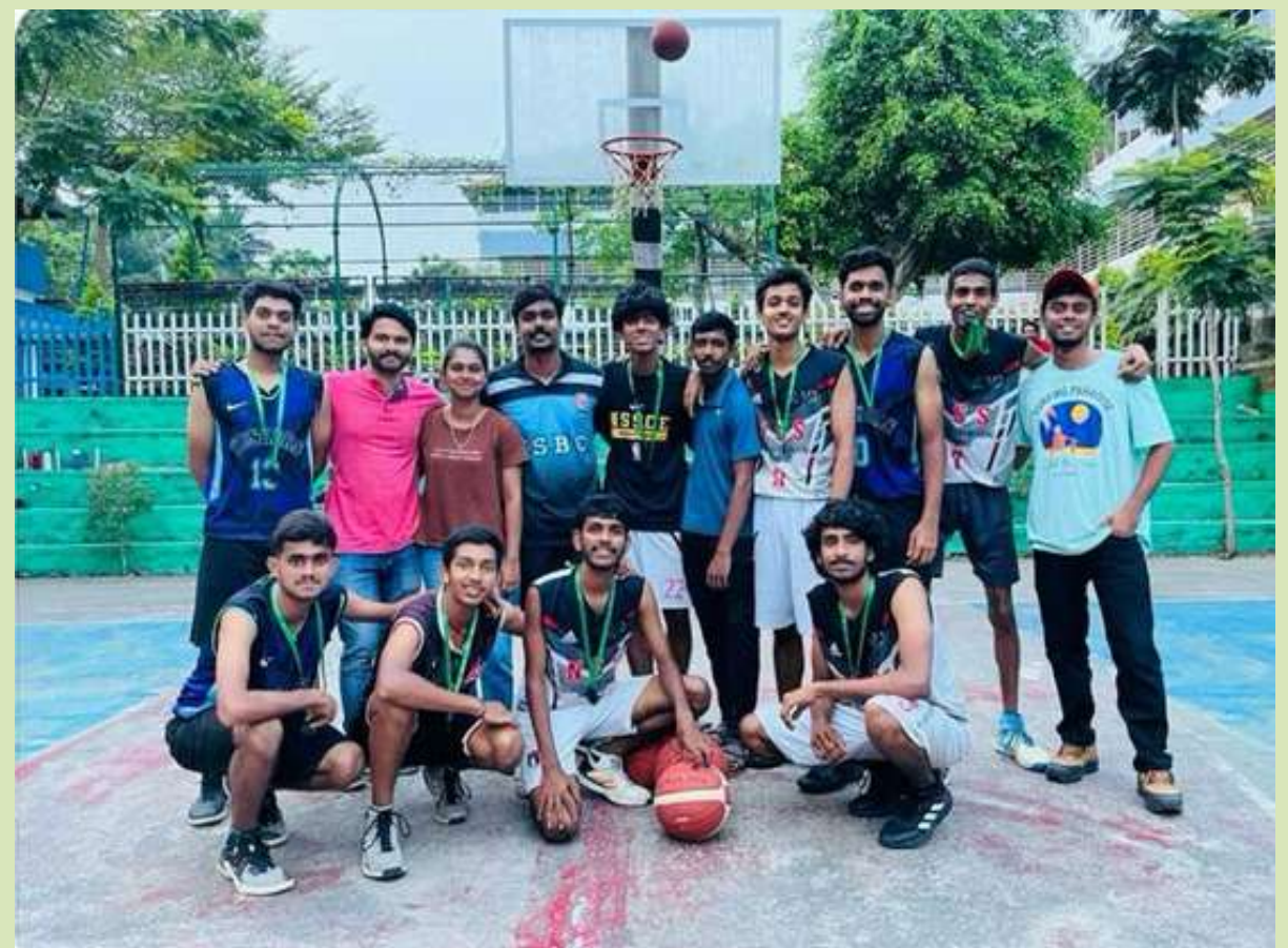
2nd Runner Up on Palakkad Senior District Championship.