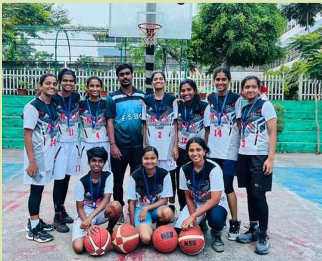
1st Runner Up on Palakkad Senior District Championship.