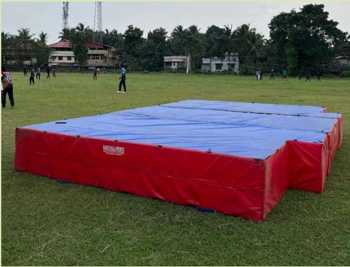
A new high jump pit sponsored by Alumni members of 1983-87 and 1993-97 batches was inaugurated by principal Dr.P.R.Suresh at college ground.