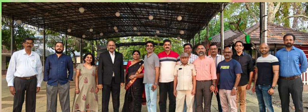
A meeting of the members of our alumni at Ernakulam, was held on 21st February to revive the Ernakulam alumni chapter.

1981ൽ പാലക്കാട് എൻ.എസ്.എസ്. എഞ്ചിനീയറിംഗ് കോളേജിൽ നിന്നും ബിരുദം നേടി പുറത്തിറങ്ങിയ സഹപാഠികൾ വീണ്ടും ഒത്തുകൂടി. പഴയ അധ്യാപകരോടൊപ്പം കോളേജ് കാമ്പസിൽ വീണ്ടും കുറച്ചു സമയം ചിലവഴിച്ചത് മറക്കാനാവാത്ത അനുഭവമായി. പങ്കെടുത്തവർക്കെല്ലാം കോളേജിന്റെ ഭാവി സംരംഭങ്ങൾക്ക് ആവുന്നത്ര സഹായങ്ങൾ വാഗ്ദാനം ചെയ്താണ് പഴയ കാല സുഹൃത്തുക്കൾ പിരിഞ്ഞത്. മലമ്പുഴ, കൽപ്പാത്തി, മ്യൂസിയം തുടങ്ങിയ ചരിത്ര പ്രധാനമായ സ്ഥലങ്ങൾ സന്ദർശിച്ചതോടൊപ്പം, batchmates ന്റെ വക വിവിധ ഗാനമേള നൃത്തനൃത്യങ്ങൾ എല്ലാമായി ഈ കൂട്ടുചേരൽ അത്യന്തം ആഘോഷകരവും ഗൃഹാതുരത്വം ഉണർത്തുന്നവയും ആയിരുന്നു.