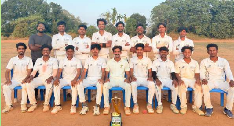
Team NSSCE won the APJAKTU zonal cricket title at Vidya academy of science & Technology.