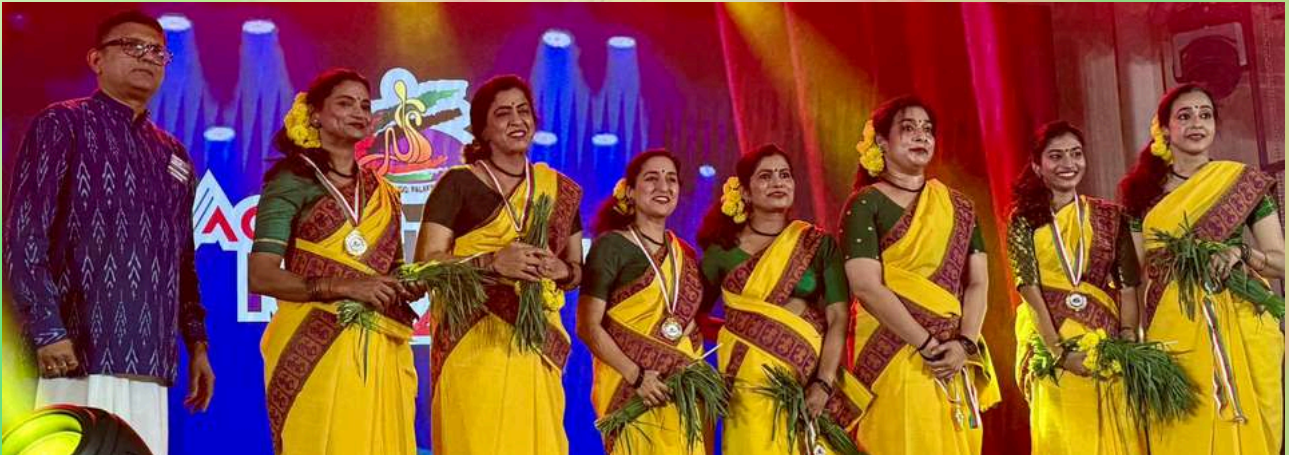
NSSCE UAE alumni family get together 2025.