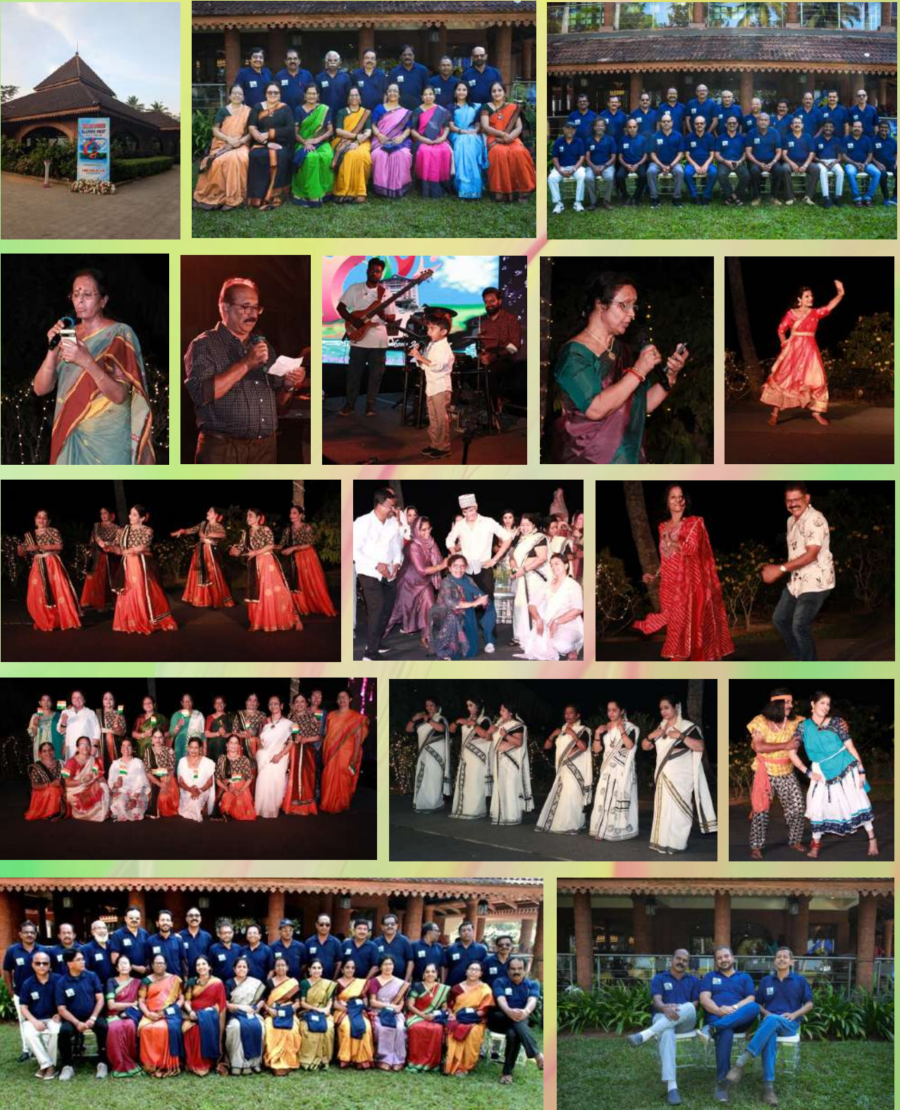
NSSCE 1981-86 batch Alumni meet “Rekindle 2025” was held on January 26-27th at Lakesong Resort, Kumarakom.