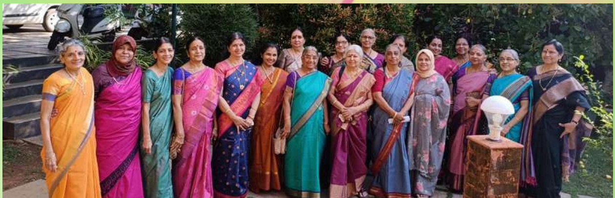
1971 batch of NSSCE reunion at Green Planet Hotel, Mattannur, Kannur on 21st to 23rd January 2025.