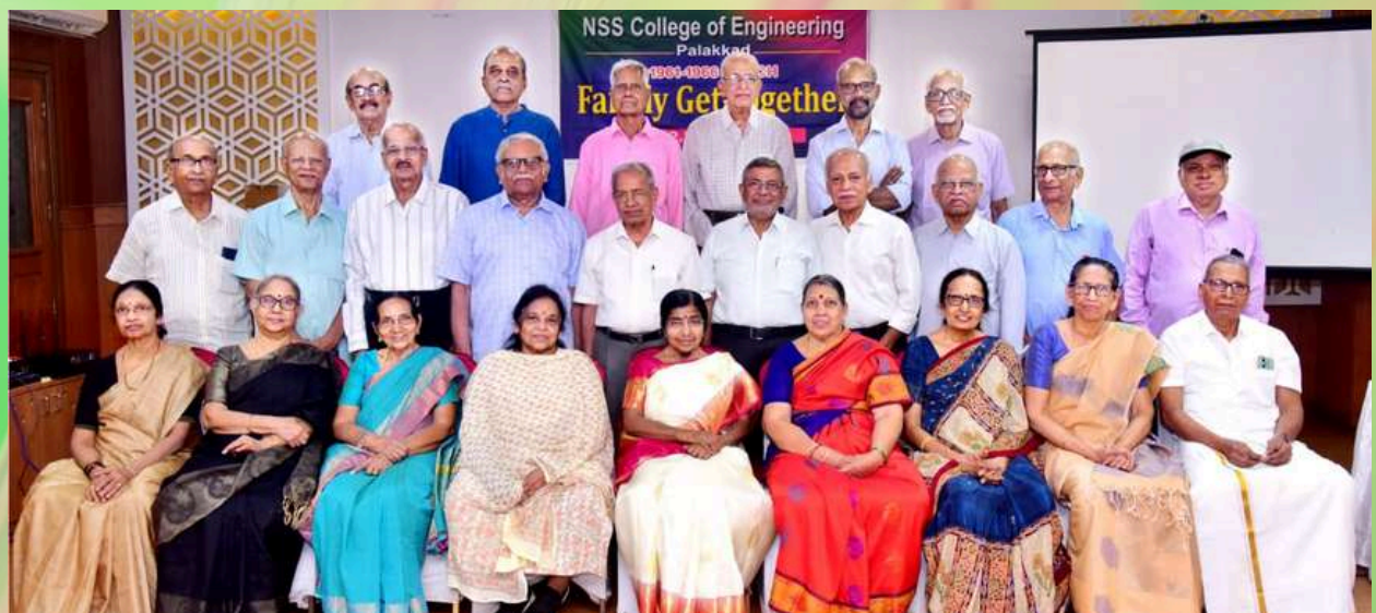
1961 -1966 batch family get-together on 16th February, 2025 at Kannur.