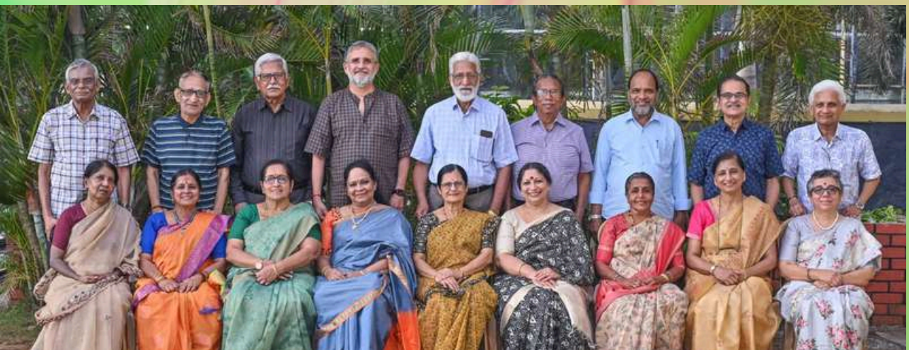
The Alumni students of the 1965-70 batch (5 years course) along with their wives met at Marmara resort / Kannur club at Payyambalam beach, Kannur between 29th to 31st January, 2025.