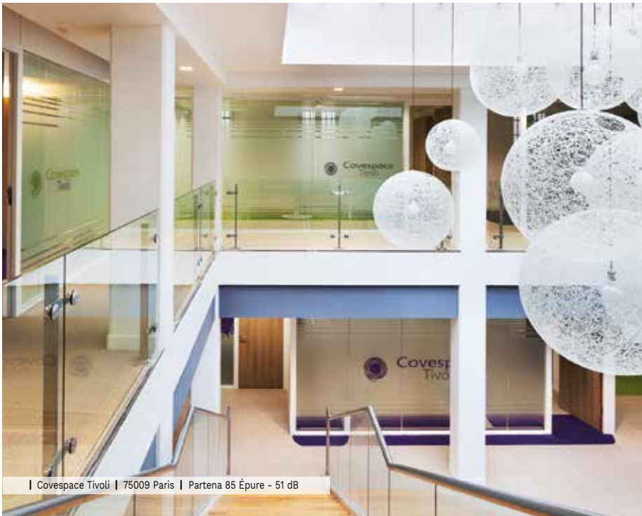
| Covespace Tivoli | 75009 Paris | Partena 85 Épure - 51 dB