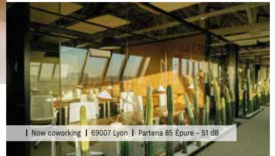
| Now coworking | 69007 Lyon | Partena 85 Épure - 51 dB