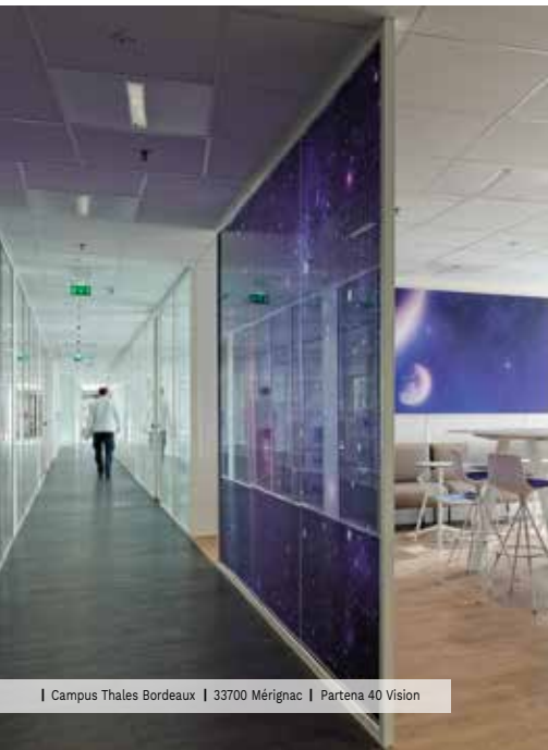
| Campus Thales Bordeaux | 33700 Mérignac | Partena 40 Vision