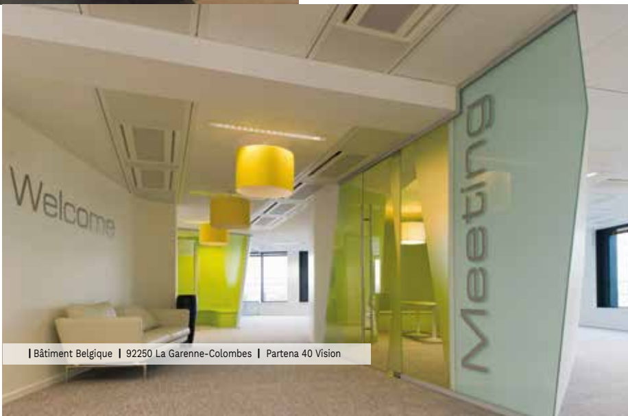
| Bâtiment Belgique | 92250 La Garenne-Colombes | Partena 40 Vision