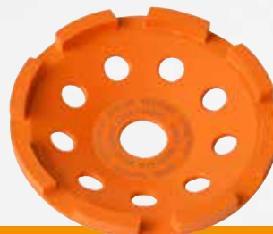
GST 125 Grinder