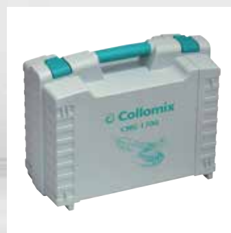
Coffret solide pour stockage sûr et pratique