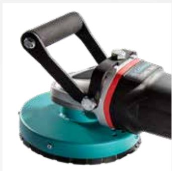
Poignée confortable pour une tenue optimale et un ponçage plus sûr.