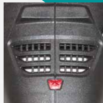
Protection anti-surcharge par contrôle visuel