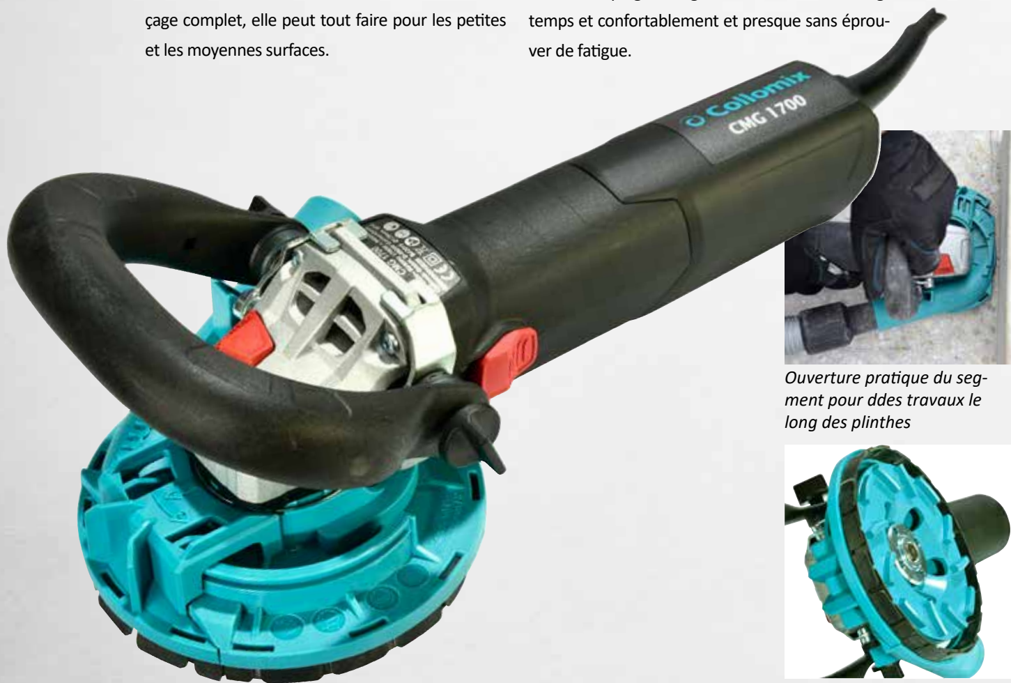
Ouverture pratique du segment pour des travaux le long des plinthes

Grâce à la poignée réglable, vous travaillez longtemps et confortablement et presque sans éprouver de fatigue.