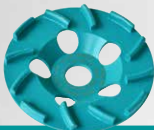
BST 125 Cyclon

pour la ponceuse à béton CMG 1700 (∅ 125 mm)