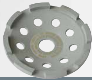
UST 125 Universal