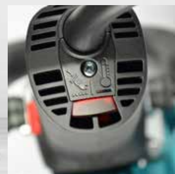
Protection anti-surcharge par contrôle visuel