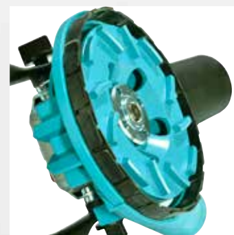
Anneau à lamelles fermé pour des travaux générant peu de poussière*