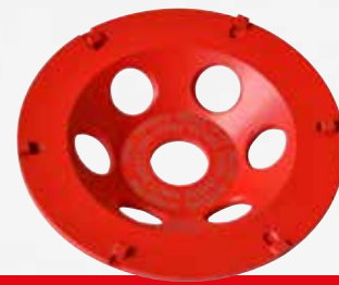
PST 125 Strap-it