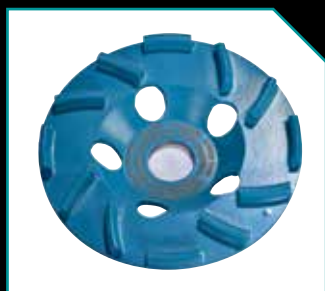
Schleiftopf BST 12

Neues Motorkonzept für mehr Ausdauer Hochleistungs-Schleiftopf für besseren Abtrag