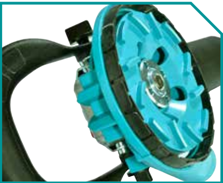
Staubschutzhäube mit Absaugstutzen und Lamellenring