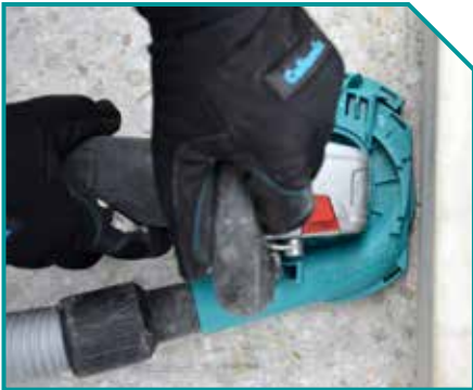
Praktische Segmentöffnung für randgenaues Arbeiten

Zum Entfernen von Kleberrückständen bei Fliesen- und Bodenbelägen; Abtragen von Beton- und Estrichflächen; Entfernen von Schalungsnähten, Beschichtungen und Anstrichen; Abtragen und Glätten von mineralischen Oberflächen.