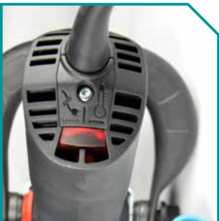
Optische Leistungs-Überwachung für sicheres Arbeiten