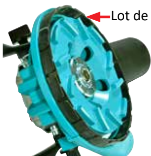
← Lot de disques

Toutes les disques à meuler Collomix Original sont automatiquement fournies avec un lot de disques de rechange pour la meule CMG 1700.