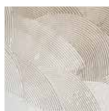
Colle à carrelage