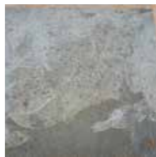
Revêtement en époxy