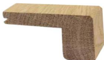
TORO QUADRATO 74x35x10 CON INCASTRO, SPIGOLO VIVO