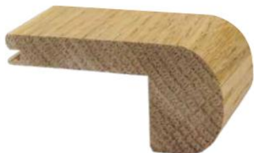
TORO STONDATO 74x35x10

Lavorazione incastro a campione vostro parquet