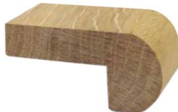
TORO STONDATO 74x35x15

con/senza incastro (secondo disponibilità) senza bisello