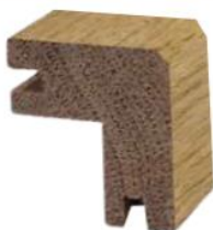
TORO QUADRATO A SEGUIRE 35x35x15 CON INCASTRO E BISELLO DISPONIBILE ANCHE SENZA INCASTRO

Forniti nelle lunghezze richieste dal cliente da 0 a 250 cm Verificare sempre disponibilità a magazzino