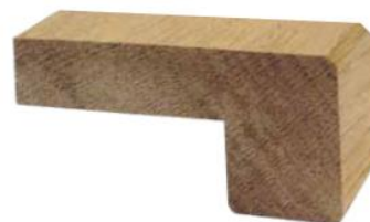
TORO QUADRATO 74x35x15 senza incastro con bisello