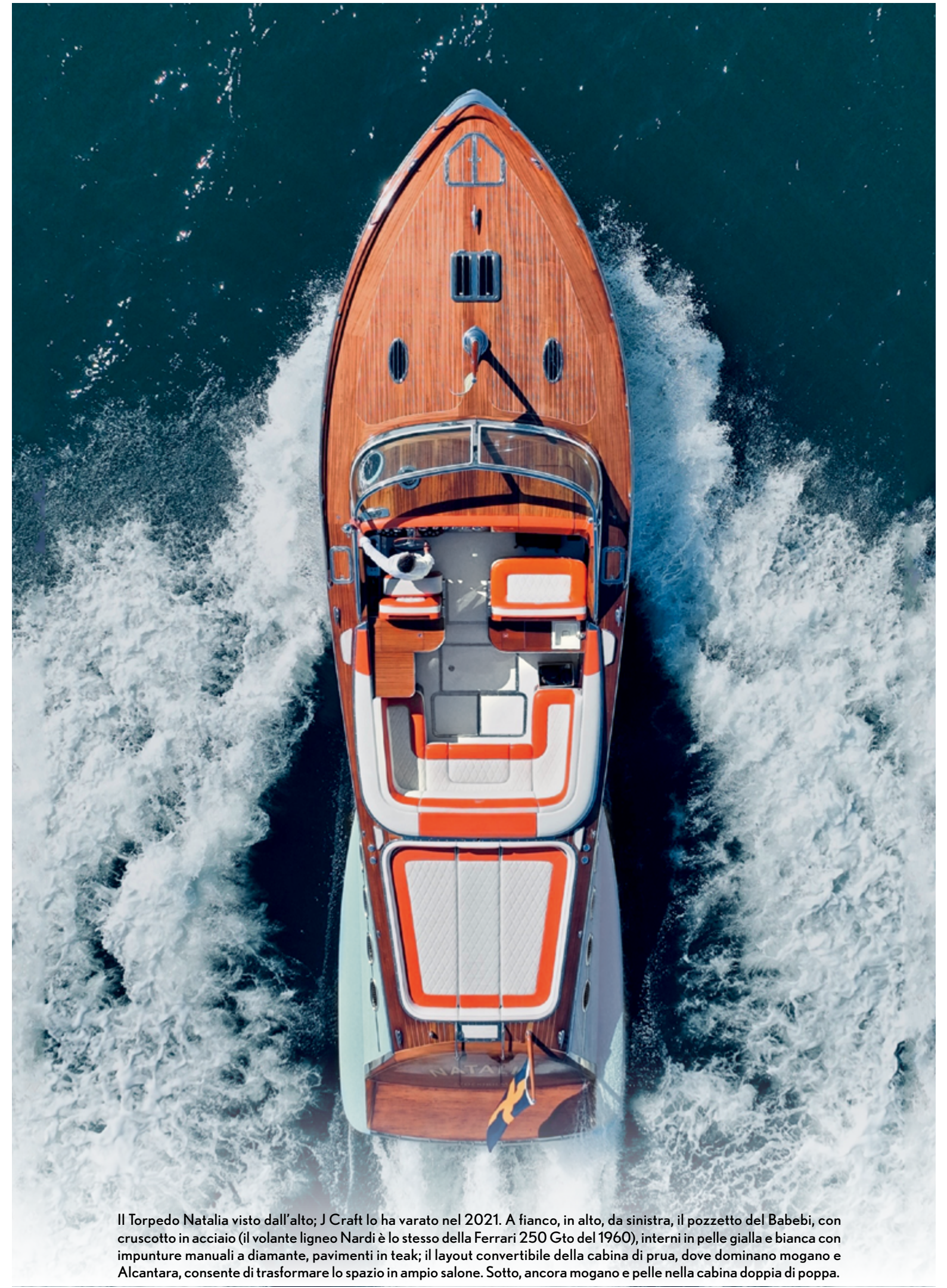
Il Torpedo Natalia visto dall'alto; J Craft lo ha varato nel 2021. A fianco, in alto, da sinistra, il pozzetto del Babebi, con cruscotto in acciaio (il volante ligneo Nardi è lo stesso della Ferrari 250 Gto del 1960), interni in pelle gialla e bianca con impunture manuali a diamante, pavimenti in teak; il layout convertibile della cabina di prua, dove dominano mogano e Alcantara, consente di trasformare lo spazio in ampio salone. Sotto, ancora mogano e pelle nella cabina doppia di poppa.