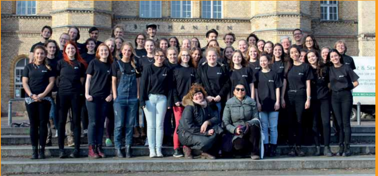
Musikprojekt „Zelle 12“ Müzik Çalıştayı