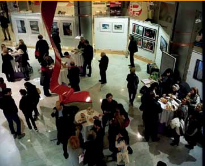
Ausstellung „urbanIstanbul „ sergisi