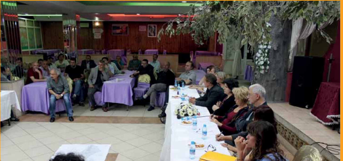
Bewohnerversammlung im Sanierungsgebiet Fikirtepe mit Besuchern aus Berlin/ Fikirtepelilerle Kentsel Dönüşüm Toplantısı