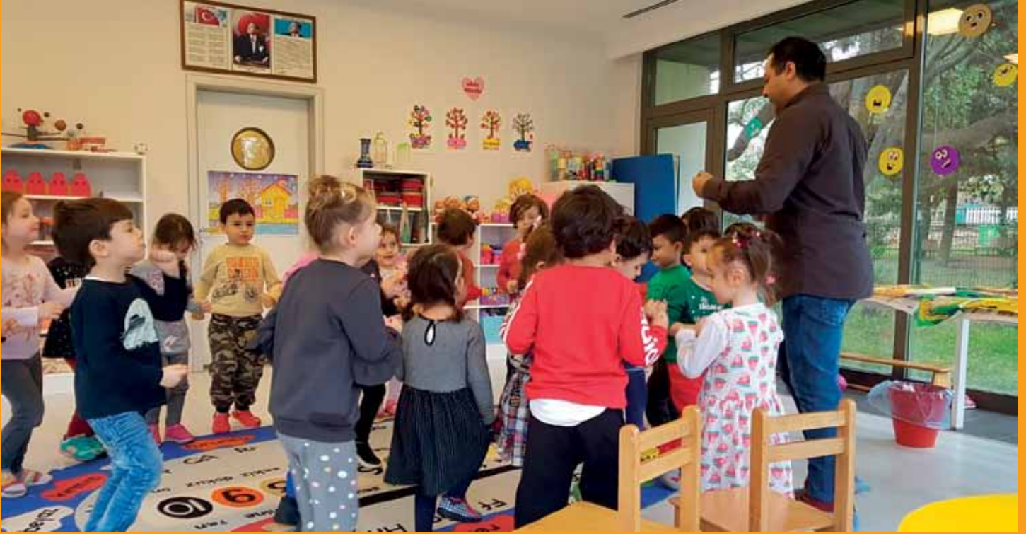
Kindergartenbesuche / Çocuk yuvası ziyareti