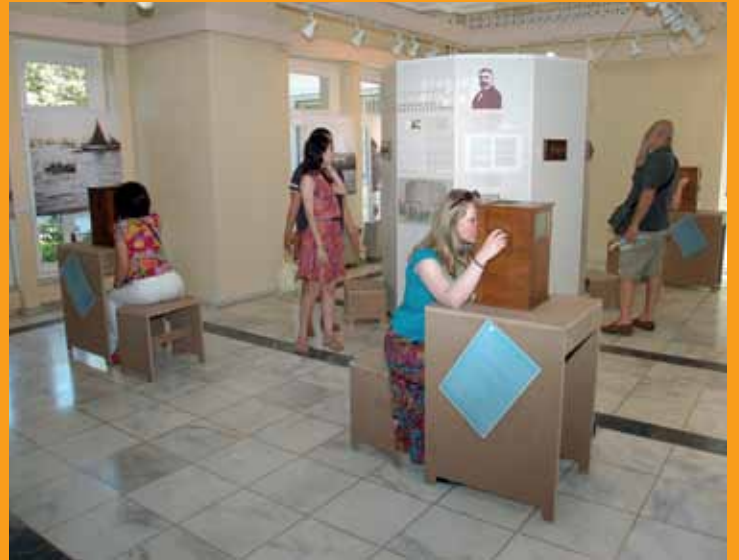
Ausstellung „Das alte Istanbul in 3 D“ Üç Boyutlu Eski İstanbul Sergisi