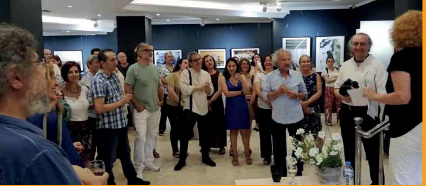
Berlin Kadraji Ausstellung/ Sergisi im Barış Manço Kulturzentrum/ Kültür Merkezi