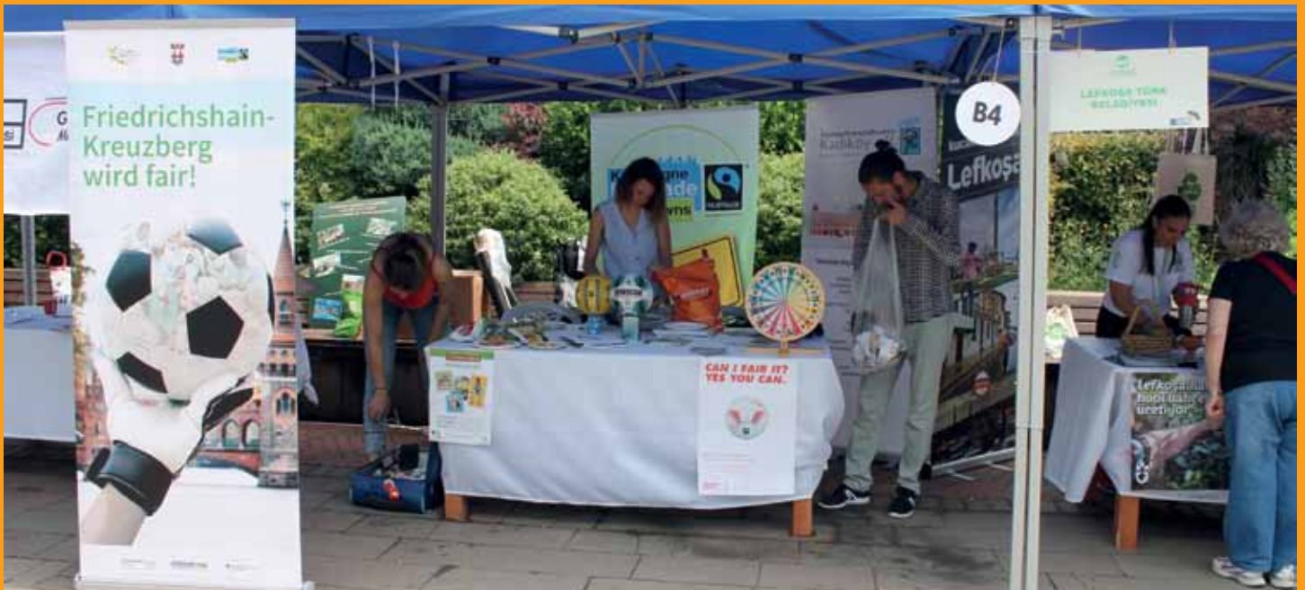
Umweltfestival in Kadıköy/Kadıköy Çevre Festivali