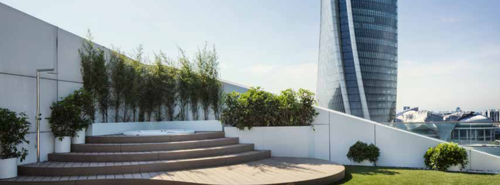
Penthouse Michelangelo, Milan