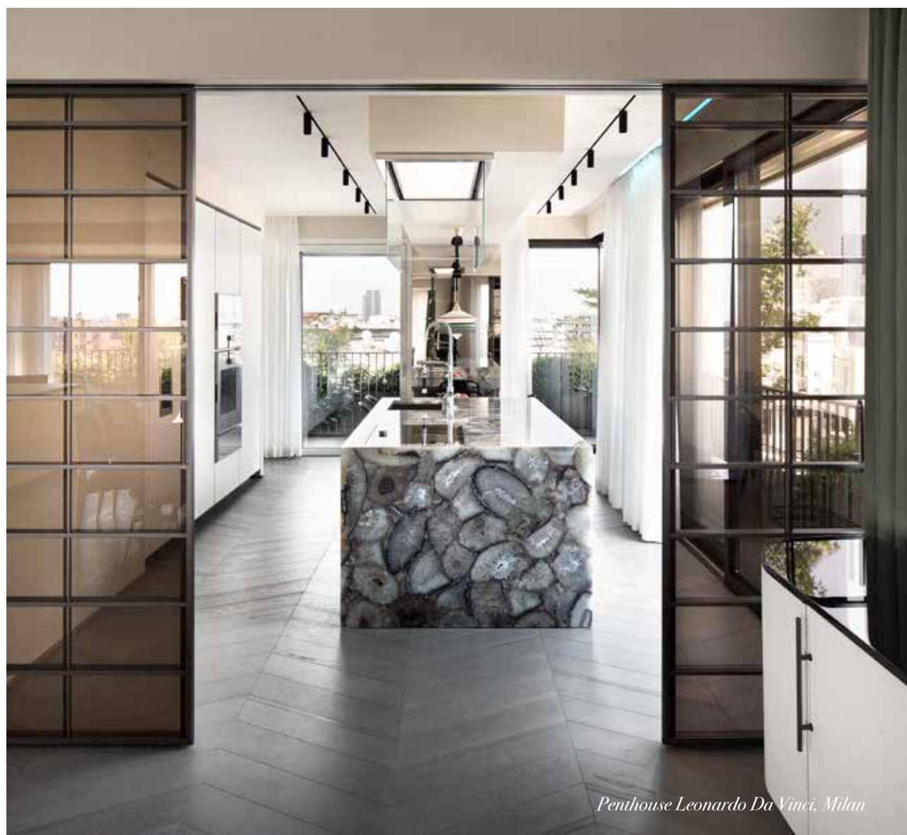
Penthouse Leonardo Da Vinci, Milan