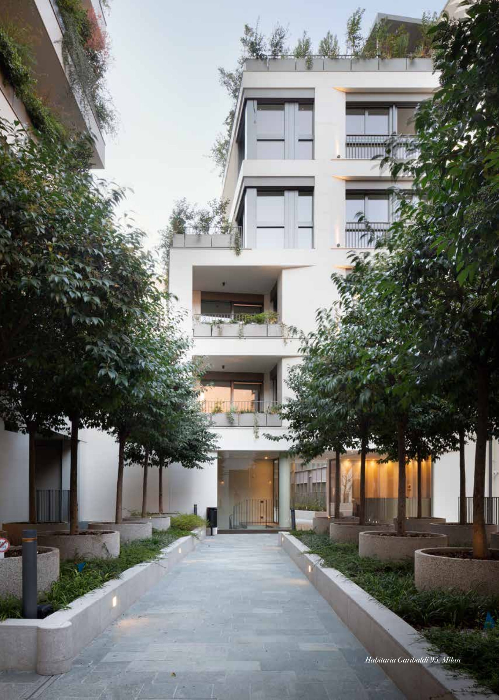
Habitaria Caribaldi 95, Milan