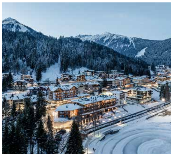
Madonna di Campiglio