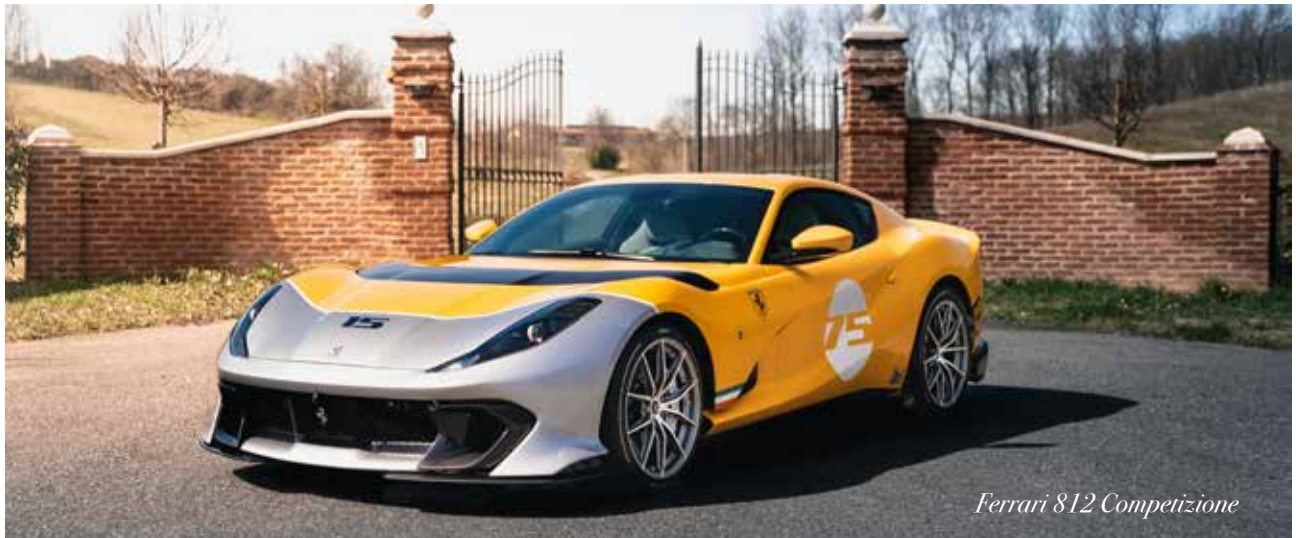
Ferrari 812 Competizione