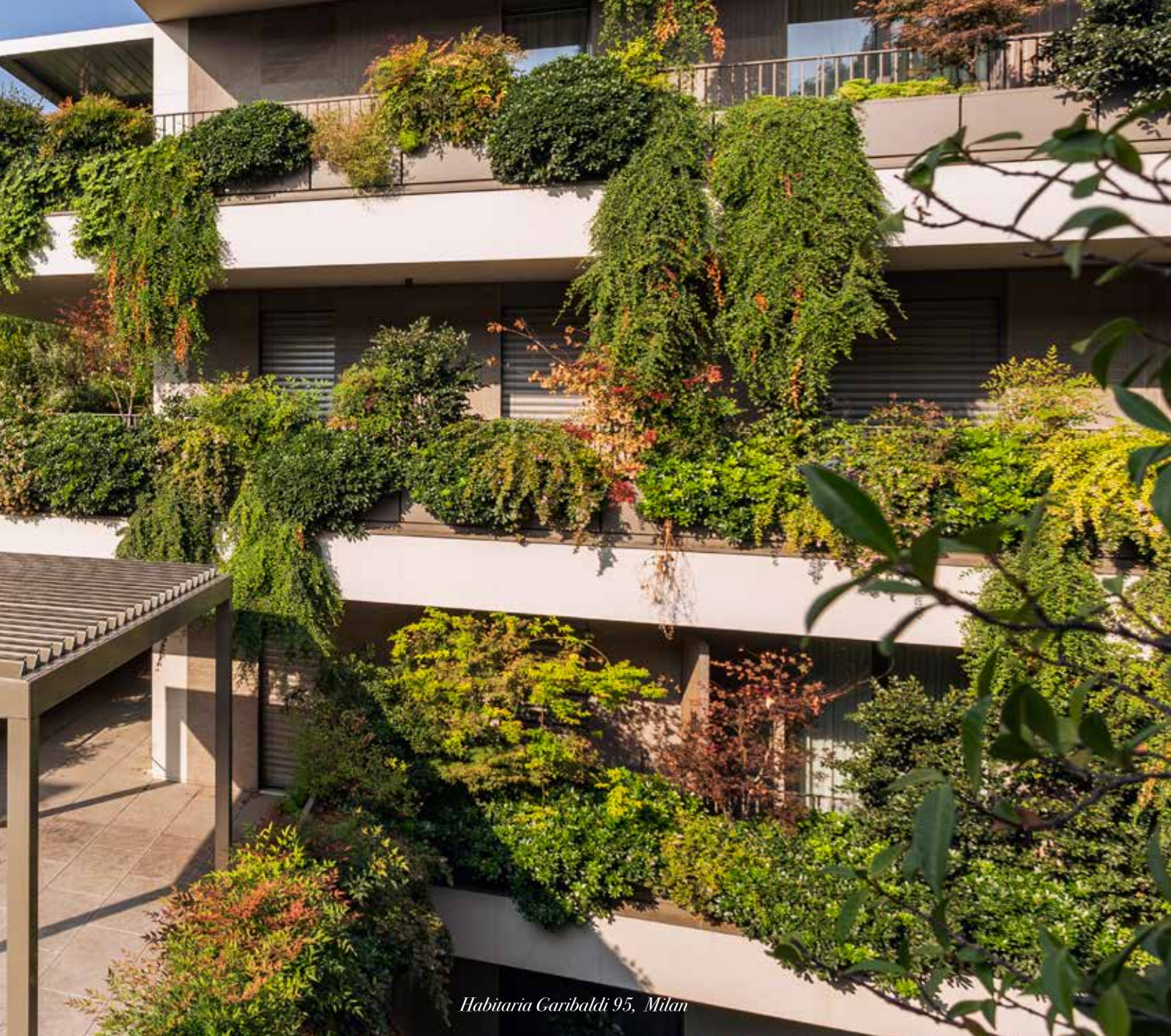
Habitaria Garibaldi 95, Milan