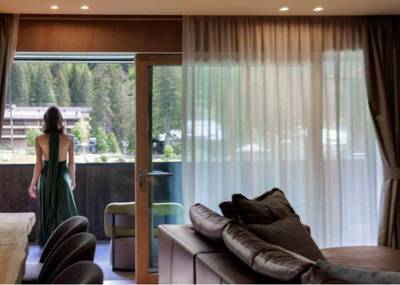
Nardis Apartment, Campiglio Wood, Madonna di Campiglio