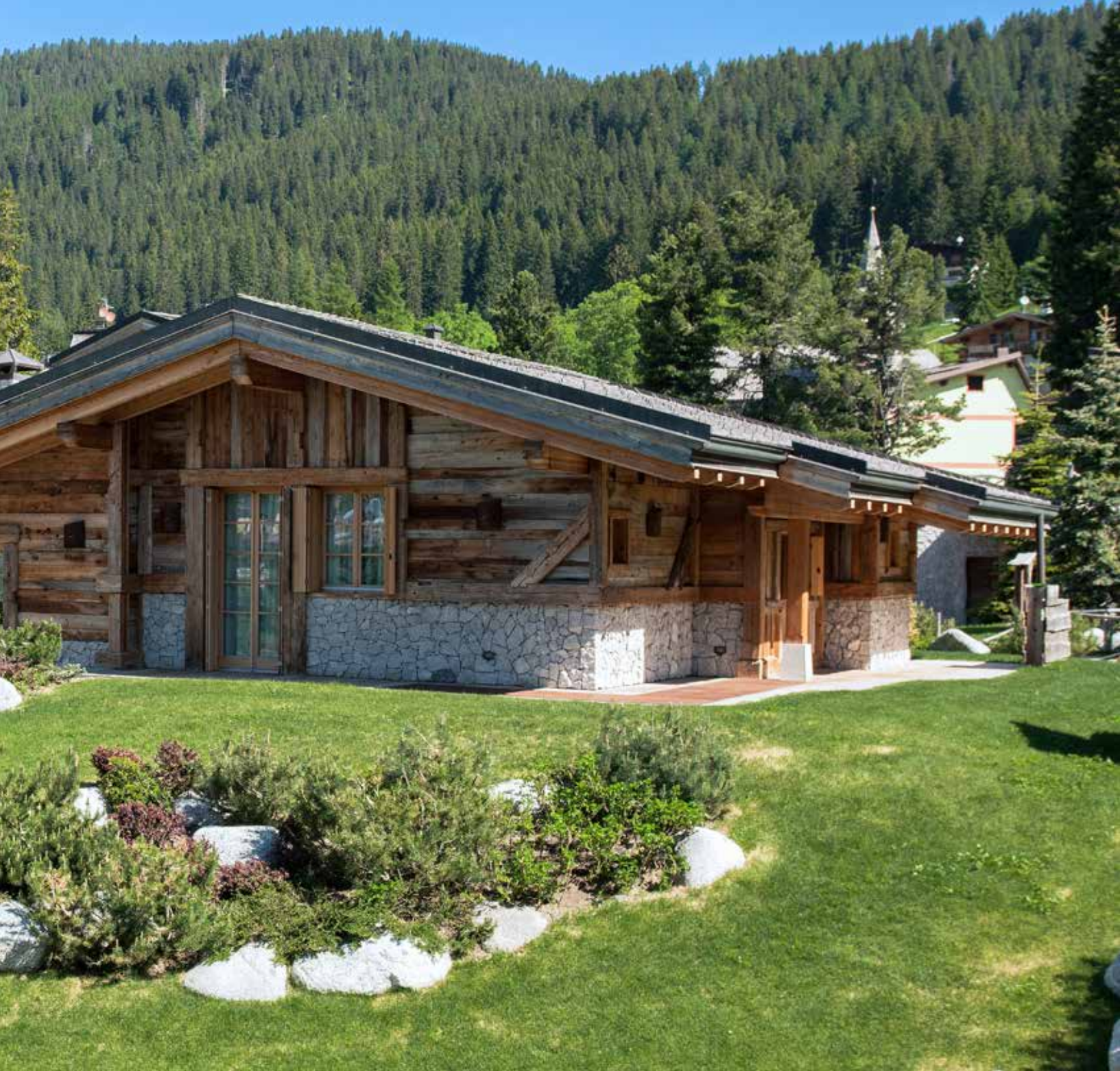
Maison De Reve, Dolomites, Madonna di Campiglio