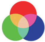
Darstellbares Farbspektrum / Displayable colour spectrum

Mischfarben werden mit der Ansteuerung mehrerer Eingänge gleichzeitig erreicht. / Mixed colours will be achieved with the control of multiple inputs simultaneously.