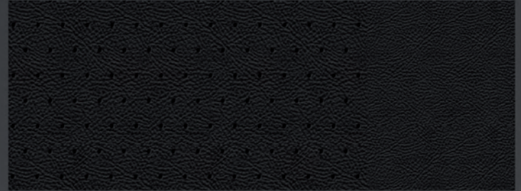
Perforiertes / unperforiertes Leder Claudia, schwarz – Kontrastnaht Impala Beige i. V. m. Allure