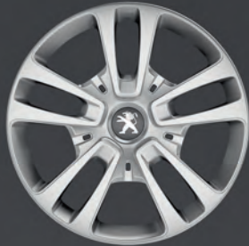
Radzierblende 16" "San Francisco"