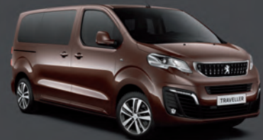
Rich Oak Braun