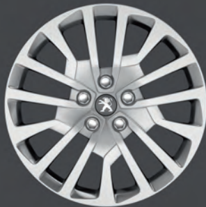
Radzierblende 17" "Miami"