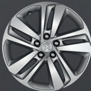
Leichtmetallfelge 17" "Phoenix"