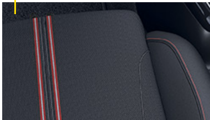
Stoff Banda, Schwarz (Sportsitze, Fahrer und Beifahrer) 3 .