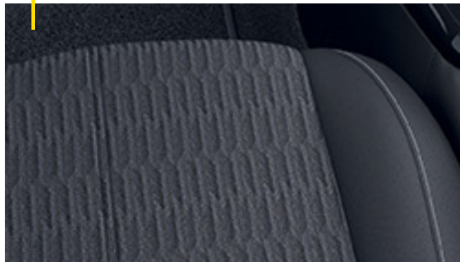
Stoff Fresez, Schwarz 1 .