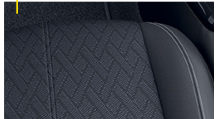
Stoff Imagination, Dunkelblau/Premium-Lederoptik, Schwarz 2 .