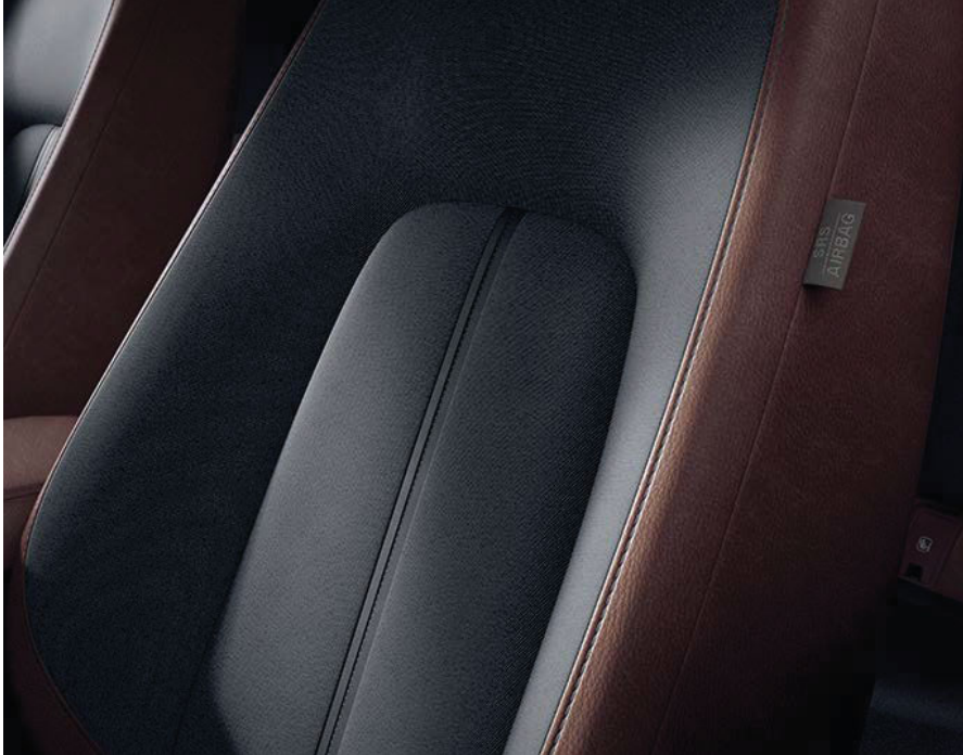
Makoto (Industrial Vintage)