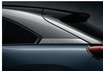
Polymetal Grau Metallic 3-Ton