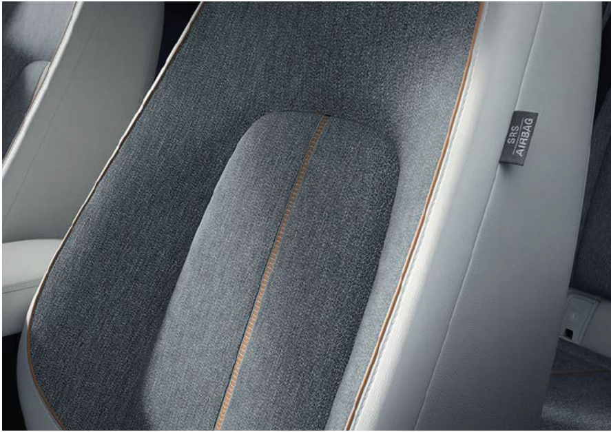
Makoto (Modern Confidence)