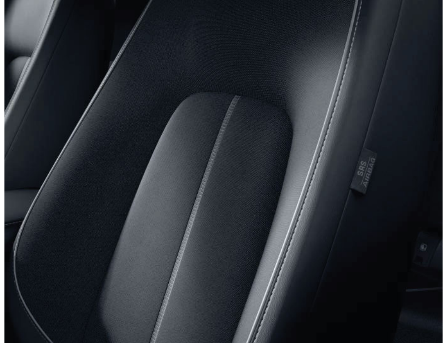
Makoto (Urban Expression)