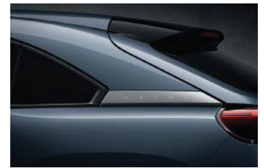
Polymetal Grau Metallic