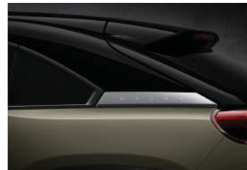
Zircon Sand Metallic 3-Ton

Konfigurieren Sie Ihren Mazda MX-30. https://www.mazda.at/konfigurator/mazda-mx-30