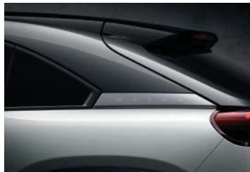
Ceramic Metallic 3-Ton