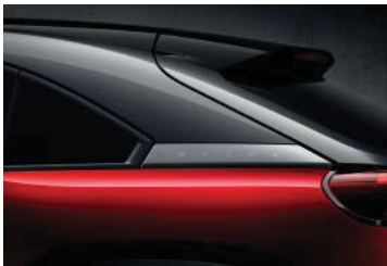
Crystal Soul Rot 3-Ton