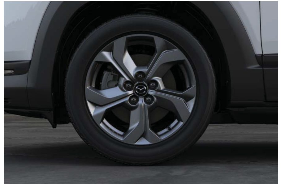
Leichtmetallfelgen - Hochglanz