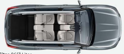
5 Sitze 865 § Liter