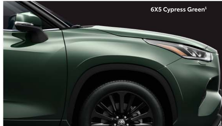
6X5 Cypress Green s