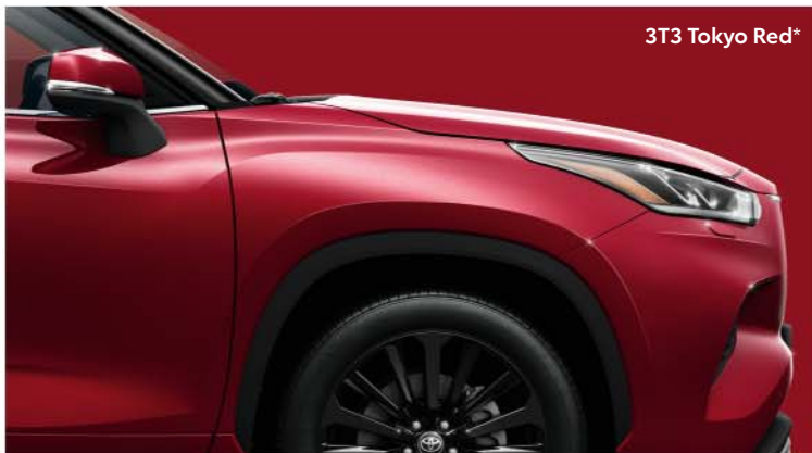
3T3 Tokyo Red *