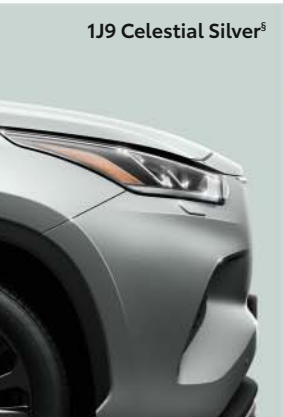
1J9 Celestial Silver s