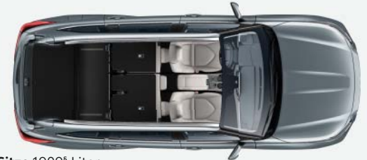
2 Sitze 1909 § Liter