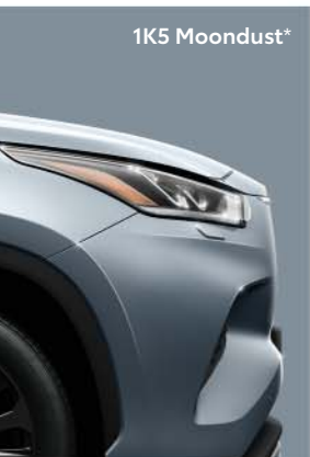
1K5 Moondust *