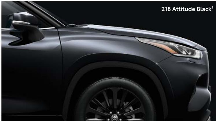
218 Attitude Black s