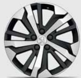
Leichtmetallfelgen 17" AORAKI*