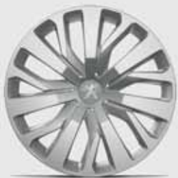
Stahlfelgen 16" mit Radzierblende RAKIURA*