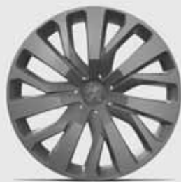
Stahlfelgen 16" mit Radzierblende TONGARIRO*