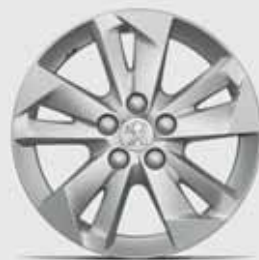
Leichtmetallfelgen 16" TARANAKI*