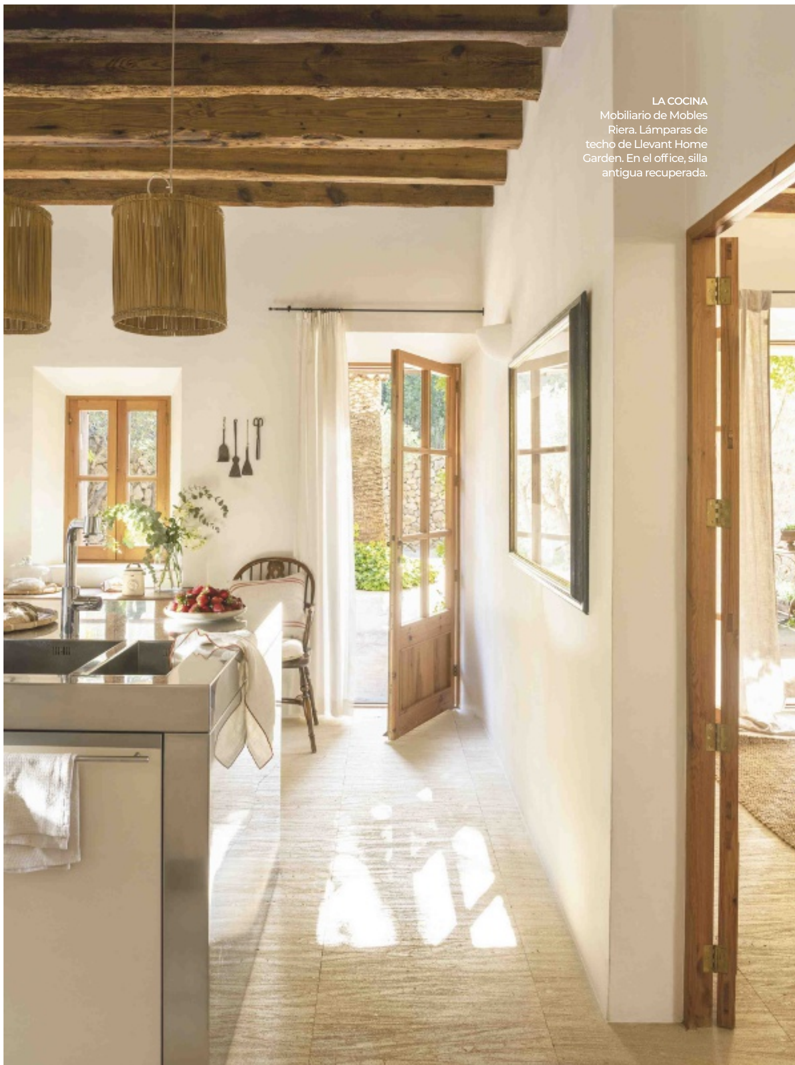
LA COCINA Mobiliario de Mobles Riera. Lámparas de techo de Llevant Home Garden. En el office, silla antigua recuperada.