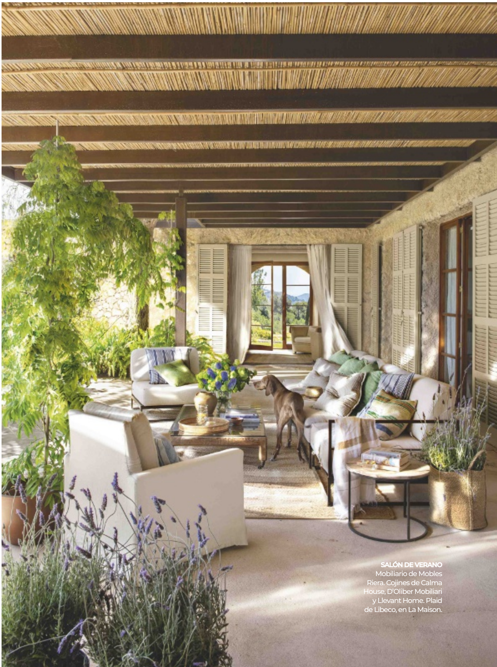
SALÓN DE VERANO Mobiliario de Mobles Riera. Cojines de Calma House, D'Oliber Mobiliari y Llevant Home. Plaid de Libeco, en La Maison.