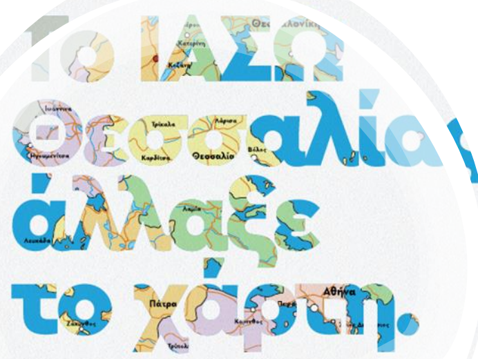
Το ΙΑΣΩ Θεσσαλίας άλλαξε το χάρτη της Υγείας στην Κεντρική Ελλάδα.