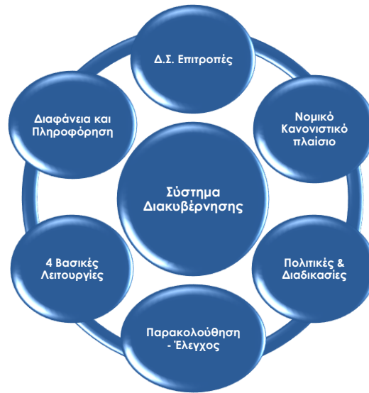
Διάγραμμα: Συνοπτική απεικόνιση Συστήματος Διακυβέρνησης

Η συμμετοχή των τεσσάρων μελών του Δ.Σ. της Εθνικής Ασφαλιστικής στο Δ.Σ. της Συμμετέχουσας, εξασφαλίζει ότι η διακυβέρνηση εφαρμόζεται με συνέπεια, όχι μόνο στον Υπο-Όμιλο, αλλά και συνολικά στο επίπεδο του Ομίλου.