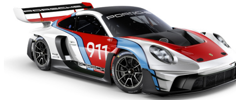
Rennsport Reunion Design