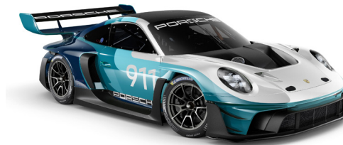
Speed Icon Design