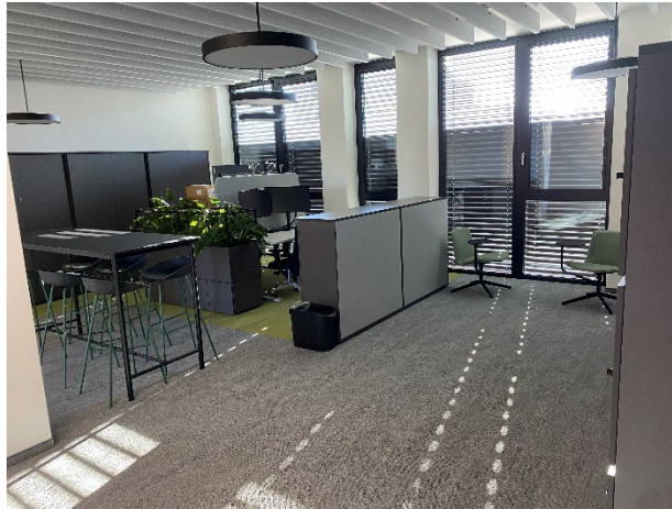
Abb. 5. Züblin Innovation Center Stuttgart

Die Ed. Züblin AG , Stuttgart, beschäftigt rd. 15.000 Mitarbeiter:innen und ist mit einer jährlichen Leistung von rd. 4,5 Mrd. € eines der größten deutschen Bauunternehmen. ZÜBLIN realisiert seit 1898 erfolgreich anspruchsvolle Bauprojekte im In- und Ausland und ist im STRABAG-Konzern die führende Marke für Hoch- und Ingenieurbau. Das Leistungsspektrum umfasst alle baurelevanten Aufgaben – vom komplexen Schlüsselfertigbau, Ingenieur- und Tunnelbau bis hin zu Baulogistik, Bauwerkserhaltung, Spezialtiefbau, Holz- oder Stahlbau. Gestützt auf das Know-how ihrer Zentralen Technik bietet ZÜBLIN zudem integriertes Planen und Bauen aus einer Hand an. Wir betrachten Bauwerke ganzheitlich, über den gesamten Lebenszyklus, setzen auf partnerschaftliches Bauen mit TEAMCONCEPT® und treiben Digitalisierung, Nachhaltigkeit und Innovation stetig voran. Gemeinsam, im STRABAG-Konzernverbund und mit externen Partner:innen, arbeiten wir konsequent daran, Planen und Bauen ressourcenschonend und klimaneutral zu machen. Aktuelle ZÜBLIN-Bauprojekte sind unter anderem das Hochhausprojekt EDGE East Side Berlin, das US-Klinikum Weilerbach oder der rd. 2 km lange Flughafentunnel in Stuttgart. Weitere Informationen unter www.zueblin.de