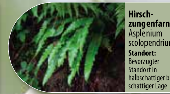
Hirschwurmfarn Asplenium scolopendrium Standort: Bevorzugter Standort in halbschattiger bis schattiger Lage