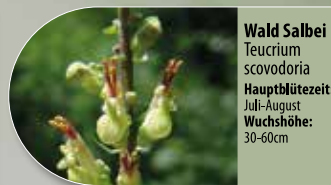
Wald Salbei Teucrium scovodoria Hauptblütezeit: Juli-August Wuchshöhe: 30-60cm