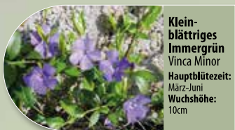
Kleinblättriges Immergrün Vinca minor Hauptblütezeit: März-Juni Wuchshöhe: 10cm