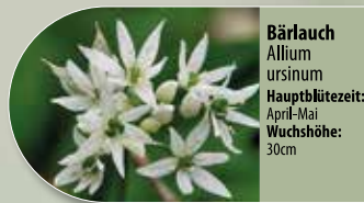
Bärlauch Allium ursinum Hauptblütezeit: April-Mai Wuchshöhe: 30cm