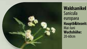
Waldsanikel Sanicula europaea Hauptblütezeit: Mai-Juni Wuchshöhe: 20-60cm