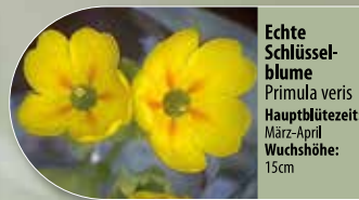
Echte Schlüsselblume Primula veris Hauptblütezeit: März-April Wuchshöhe: 15cm