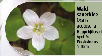
Waldsauerklee Oxalis acetosella Hauptblütezeit: April-Mai Wuchshöhe: 5-10cm