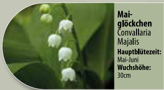
Maiglöckchen Convallaria majalis Hauptblütezeit: Mai-Juni Wuchshöhe: 30cm