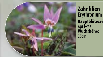
Zahn Lilien Erythronium Hauptblütezeit: April-Mai Wuchshöhe: 25cm

Um das natürliche Erscheinungsbild des Waldgebiets zu schützen, dürfen keine Pflanzen aus Gartencentern und Blumengeschäften auf die Gräber gelegt werden. Sie stören das biologische Gleichgewicht und können die biologische Vielfalt in der Natur negativ beeinflussen. Sie werden von unseren Mitarbeitern entsorgt.