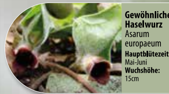
Gewöhnliche Haselwurz Asarum europaeum Hauptblütezeit: Mai-Juni Wuchshöhe: 15cm