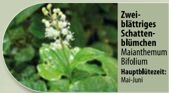
Zweiblättriges Schattenblümchen Maianthemum bifolium Hauptblütezeit: Mai-Juni