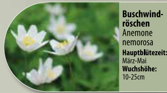
Buschwindröschen Anemone nemorosa Hauptblütezeit: März-Mai Wuchshöhe: 10-25cm