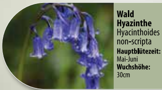
Waldhyazinthe Hyacinthoides non-scripta Hauptblütezeit: Mai-Juni Wuchshöhe: 30cm