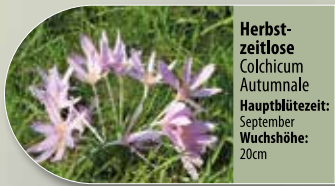
Herbstzeitlose Colchicum autumnale Hauptblütezeit: September Wuchshöhe: 20cm