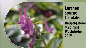
Lerchensporne Corydalis Hauptblütezeit: März-April Wuchshöhe: 20-25cm