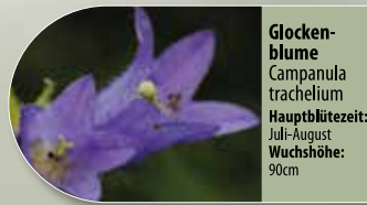
Glockenblume Campanula trachelium Hauptblütezeit: Juli-August Wuchshöhe: 90cm