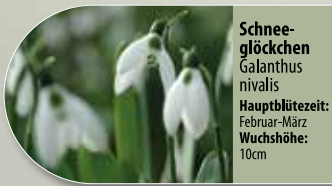
Schneeglöckchen Galanthus nivalis Hauptblütezeit: Februar-März Wuchshöhe: 10cm