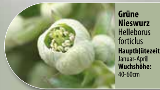
Grüne Nieswurz Helleborus foetidus Hauptblütezeit: Januar-April Wuchshöhe: 40-60cm