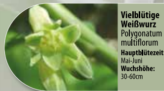
Vielblütige Weißwurz Polygonatum multiflorum Hauptblütezeit: Mai-Juni Wuchshöhe: 30-60cm