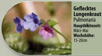
Geflecktes Lungenkraut Pulmonaria Hauptblütezeit: März-Mai Wuchshöhe: 15-20cm