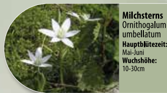
Milchstern Ornithogalum umbellatum Hauptblütezeit: Mai-Juni Wuchshöhe: 10-30cm