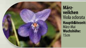
Märzveilchen Viola odorata Hauptblütezeit: März-Mai Wuchshöhe: 15cm