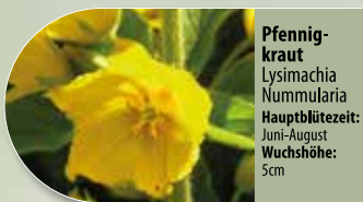
Pfennigkraut Lysimachia nummularia Hauptblütezeit: Juni-August Wuchshöhe: 5cm