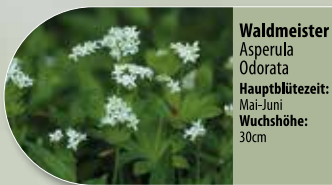
Waldmeister Asperula odorata Hauptblütezeit: Mai-Juni Wuchshöhe: 30cm