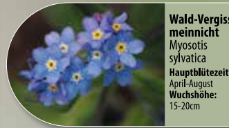
Wald-Vergissmeinnicht Myosotis sylvatica Hauptblütezeit: April-August Wuchshöhe: 15-20cm