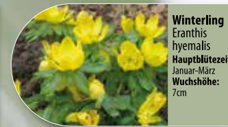
Winterling Eranthis hyemalis Hauptblütezeit: Januar-März Wuchshöhe: 7cm