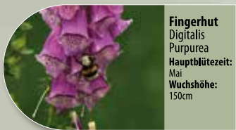
Fingerhut Digitalis purpurea Hauptblütezeit: Mai Wuchshöhe: 150cm