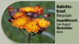
Habichtskraut Hieracium Hauptblütezeit: Juni-August Wuchshöhe: 60cm

Für Lieferanten von Wildpflanzen scannen Sie den QR-Code oder fragen Sie den Betreuer (Wildpflanzen sind auf dem Aschestrefefeld nicht gestattet)