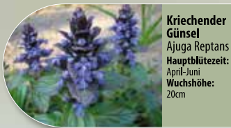
Kriechender Günsel Ajuga reptans Hauptblütezeit: April-Juni Wuchshöhe: 20cm