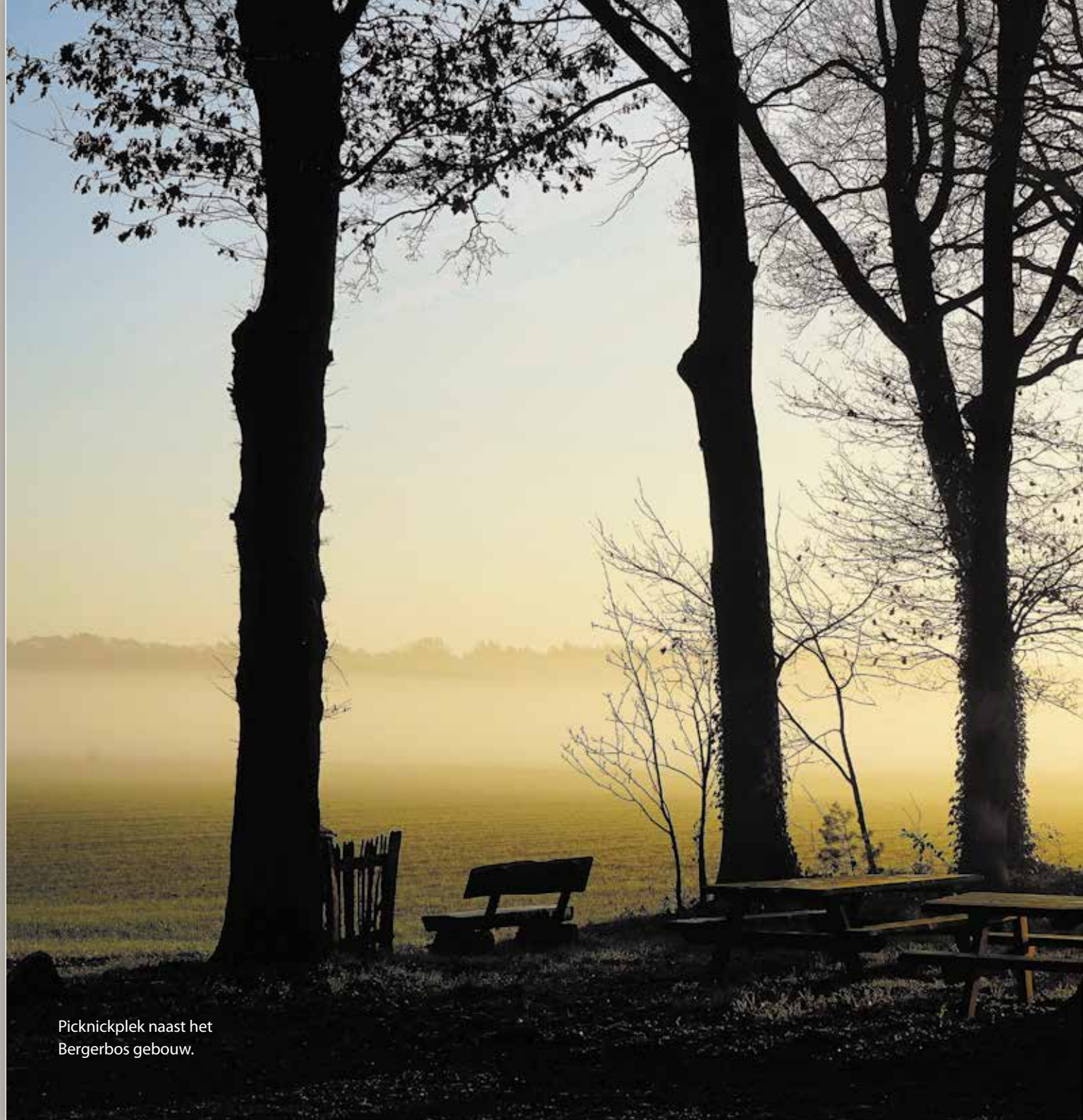
Picknickplek naast het Bergerbos gebouw.

Een asverstrooiing kan ingepland worden op werkdagen en op zaterdagochtend.