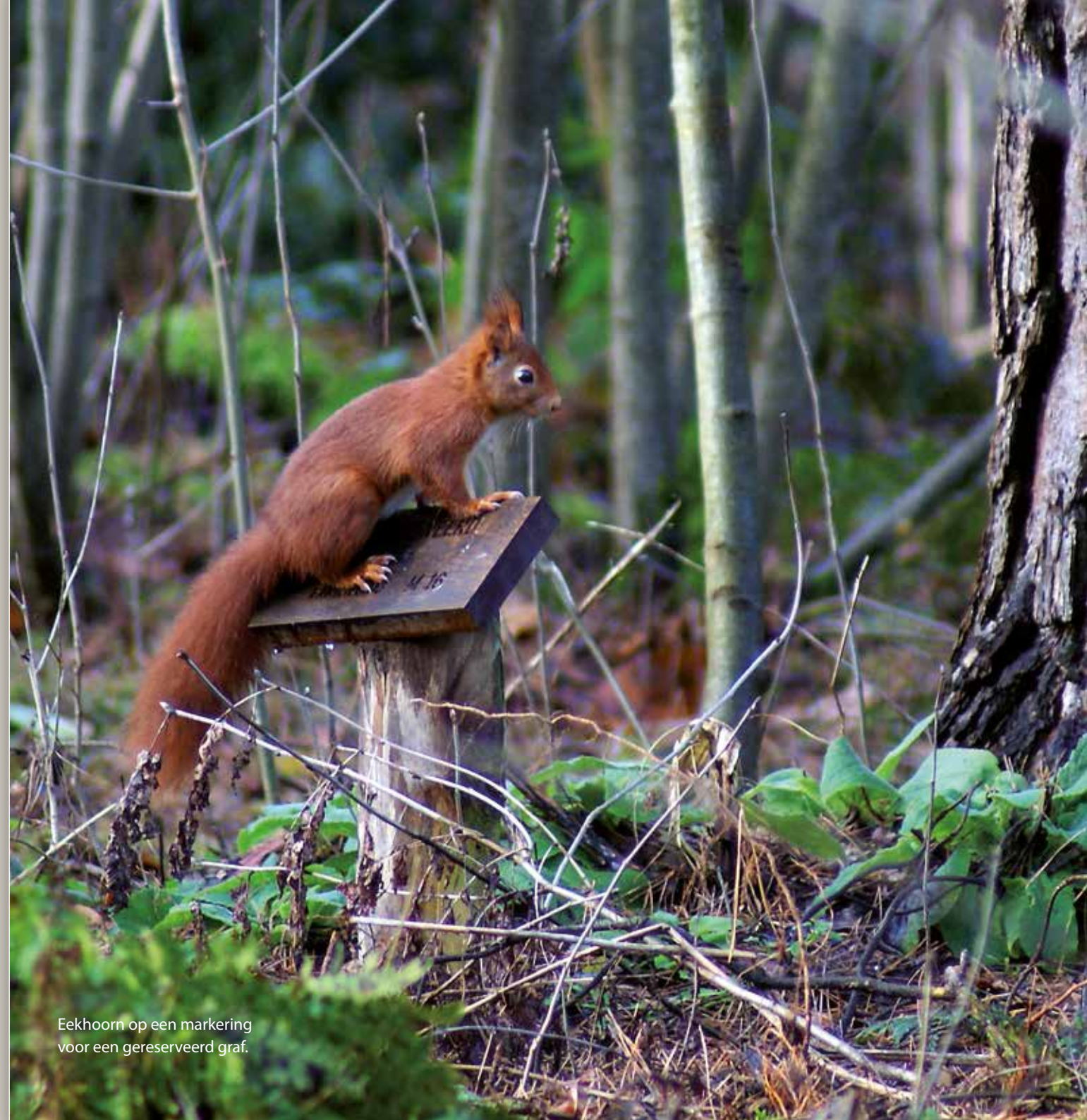
Eekhoorn op een markering voor een gereserveerd graf.

Na afloop van de looptijd van een graf wordt alleen de markering verwijderd. De stoffelijke resten worden niet geruimd.