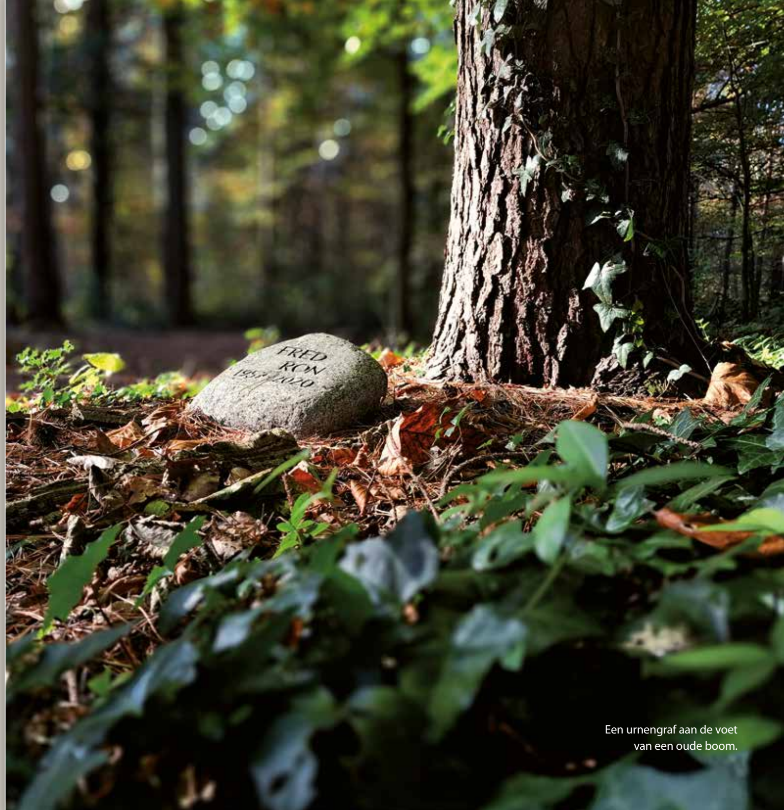
Een urnengraf aan de voet van een oude boom.

Ieder graf wordt vastgelegd in het grafregister en beschreven in een grafakte.