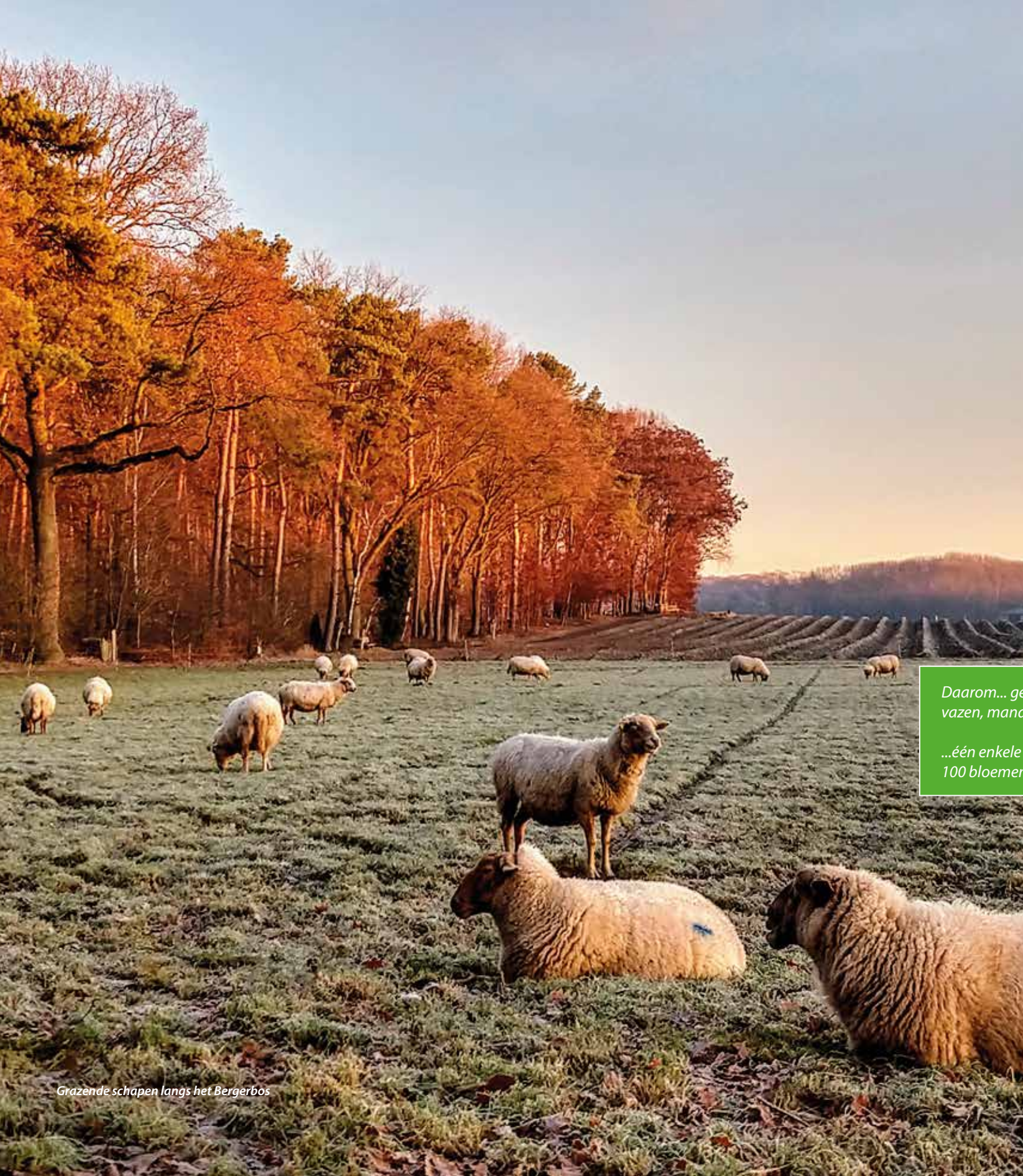
Grazende schapen langs het Bergerbos