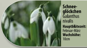
Schneeglöckchen Galanthus nivalis Hauptblütezeit: Februar-März Wuchshöhe: 10cm