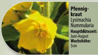
Pfennigkraut Lysimachia nummularia Hauptblütezeit: Juni-August Wuchshöhe: 5cm