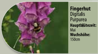
Fingerhut Digitalis purpurea Hauptblütezeit: Mai Wuchshöhe: 150cm