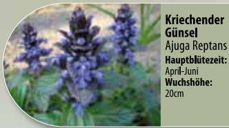
Kriechender Günsel Ajuga reptans Hauptblütezeit: April-Juni Wuchshöhe: 20cm