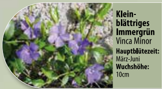
Kleinblättriges Immergrün Vinca minor Hauptblütezeit: März-Juni Wuchshöhe: 10cm