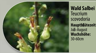
Wald Salbei Teucrium scovodoria Hauptblütezeit: Juli-August Wuchshöhe: 30-60cm