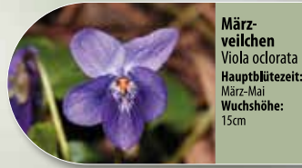
Märzveilchen Viola odorata Hauptblütezeit: März-Mai Wuchshöhe: 15cm