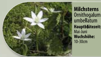
Milchstern Ornithogalum umbellatum Hauptblütezeit: Mai-Juni Wuchshöhe: 10-30cm