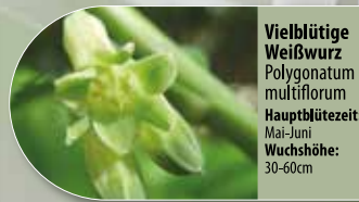
Vielblütige Weißwurz Polygonatum multiflorum Hauptblütezeit: Mai-Juni Wuchshöhe: 30-60cm