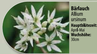
Bärlauch Allium ursinum Hauptblütezeit: April-Mai Wuchshöhe: 30cm