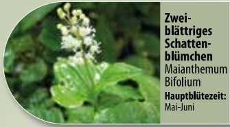
Zweiblättriges Schattenblümchen Maianthemum bifolium Hauptblütezeit: Mai-Juni