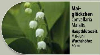
Maiglöckchen Convallaria majalis Hauptblütezeit: Mai-Juni Wuchshöhe: 30cm