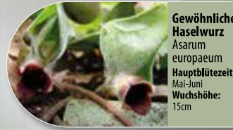
Gewöhnliche Haselwurz Asarum europaeum Hauptblütezeit: Mai-Juni Wuchshöhe: 15cm