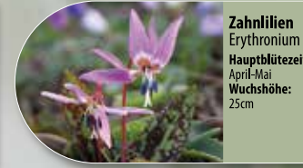
Zahn Lilien Erythronium Hauptblütezeit: April-Mai Wuchshöhe: 25cm

Um das natürliche Erscheinungsbild des Waldgebiets zu schützen, dürfen keine Pflanzen aus Gartencentern und Blumengeschäften auf die Gräber gelegt werden. Sie stören das biologische Gleichgewicht und können die biologische Vielfalt in der Natur negativ beeinflussen. Sie werden von unseren Mitarbeitern entsorgt.