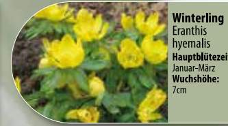
Winterling Eranthis hyemalis Hauptblütezeit: Januar-März Wuchshöhe: 7cm