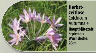
Herbstzeitlose Colchicum autumnale Hauptblütezeit: September Wuchshöhe: 20cm