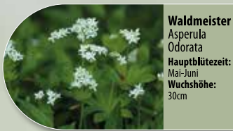
Waldmeister Asperula odorata Hauptblütezeit: Mai-Juni Wuchshöhe: 30cm