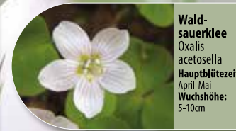
Waldsauerklee Oxalis acetosella Hauptblütezeit: April-Mai Wuchshöhe: 5-10cm