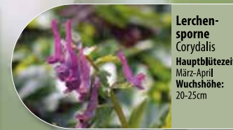
Lerchensporne Corydalis Hauptblütezeit: März-April Wuchshöhe: 20-25cm