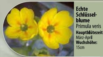
Echte Schlüsselblume Primula veris Hauptblütezeit: März-April Wuchshöhe: 15cm