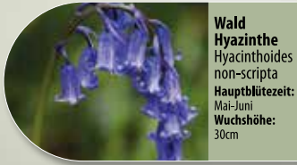
Waldhyazinthe Hyacinthoides non-scripta Hauptblütezeit: Mai-Juni Wuchshöhe: 30cm