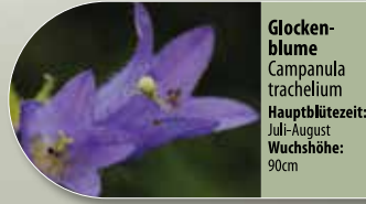
Glockenblume Campanula trachelium Hauptblütezeit: Juli-August Wuchshöhe: 90cm