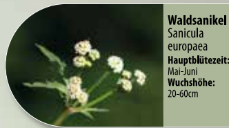
Waldsanikel Sanicula europaea Hauptblütezeit: Mai-Juni Wuchshöhe: 20-60cm