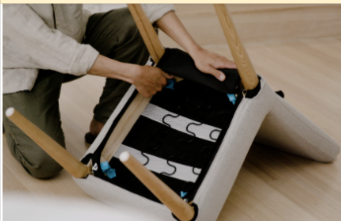
Step 3. ネジ(1脚につき2つ)を反時計回りに回してゆるめる