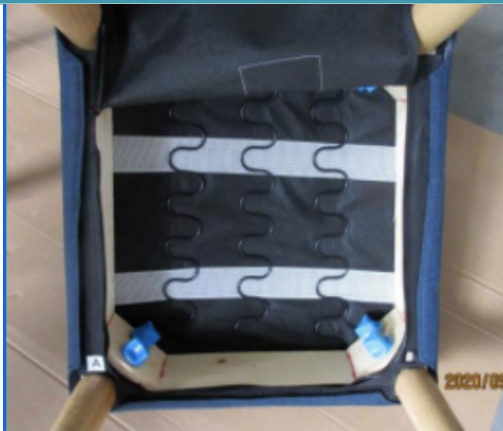
Step 2. 底面のチャックを開ける