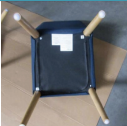
Step 1. 椅子をひっくり返す