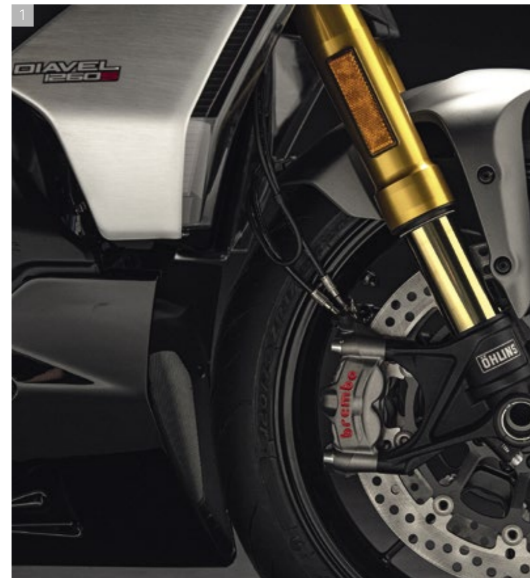
1 Suspensions Öhlins à la finition dorée entièrement réglables à l'avant et à l'arrière