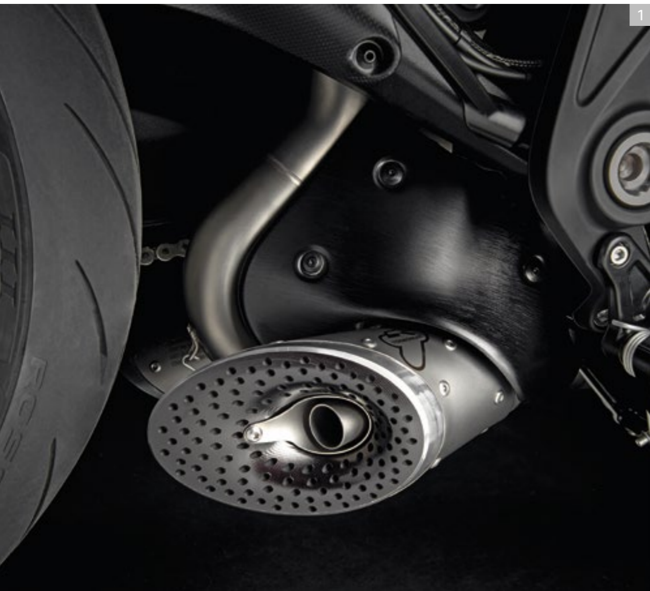
1 Ensemble d'échappement complet