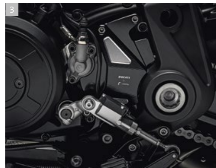
3 Cache pignon en aluminium usiné dans la masse