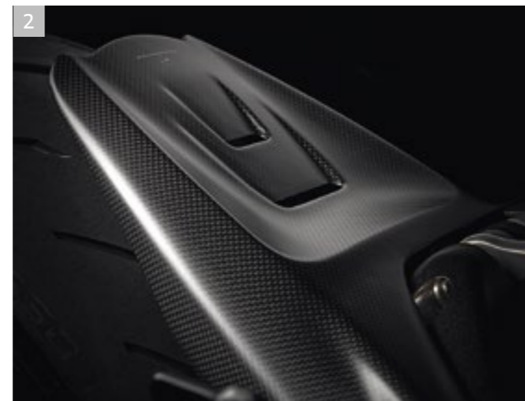
2 Garde-boue arrière en carbone