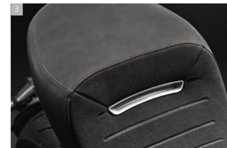
3 Selle Premium avec insert Diavel