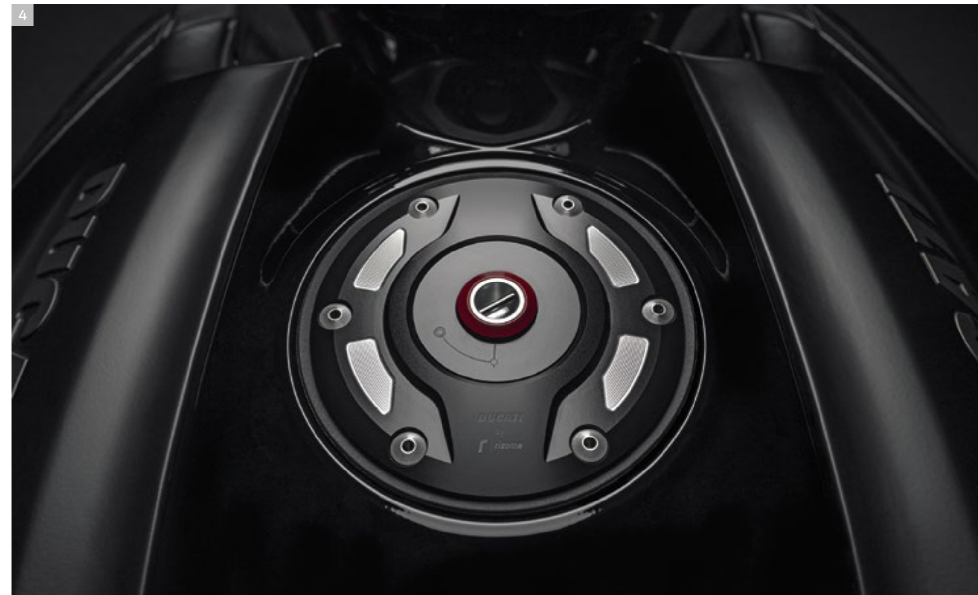
4 Bouchon du réservoir en aluminium usiné dans la masse