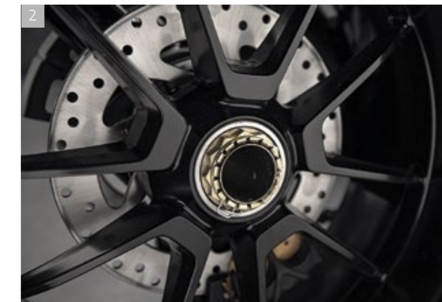
2 Jantes moulée et usinée au design exclusif