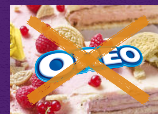
Auf unruhigem Untergrund

So sollte das Logo nicht eingesetzt werden: