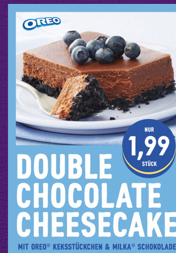
Beispiel einer Preistafel

So sollte das Logo nicht eingesetzt werden: