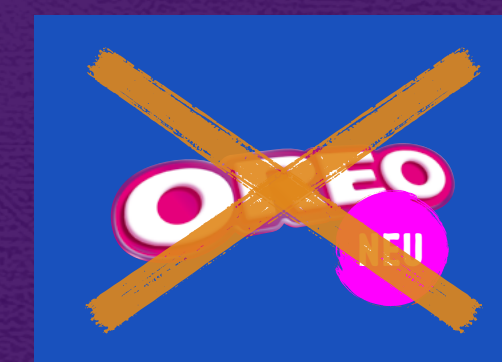
Farbänderung oder Zusatz