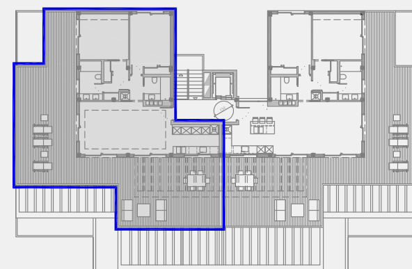
EDIFICIO 6. PLANTA ÁTICO. VT3a

NRCR arquitectos s.l.p. C/ Federnica - Montseny nº 6 Local 28100 Alcobendas (Madrid) Tél: 91 490 14 74 Fax: 91 662 38 04 www.nrcr-arquitectos.com