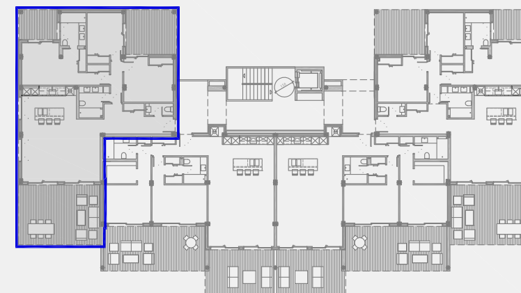
EDIFICIO 1. PLANTA BAJA. VT1a

C/ Fedrica - Montseny nº 6 Local 28100 Alcobendas (Madrid) Tel: 91 490 14 74 Fax: 91 662 38 04 www.nrcr-arquitectos.com