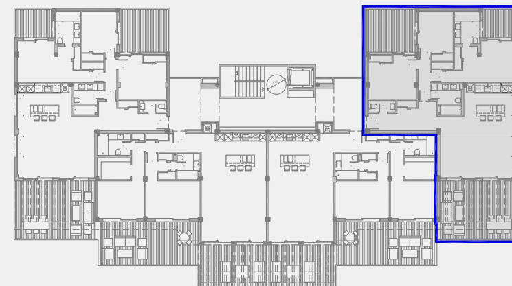
EDIFICIO 3. PLANTA 1ª. VT1d

Este plano y todos los datos incluidos en este documento son meramente informativos, no vinculantes, ni contractuales, y podrán ser modificados sin previo aviso. La información requerida por el Real Decreto 515 de 21/04/1989, sobre la defensa de los consumidores en cuanto a la información a suministrar, se encuentra a su disposición en las oficinas de AZATA PATRIMONIO S.L., con domicilio en Marbella (Málaga), Centro Comercial Oasis Business Center, Ctra. de Cádiz, km. 183.