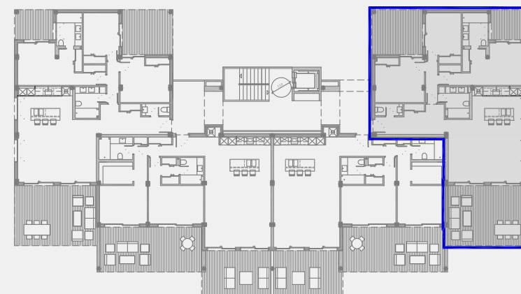
EDIFICIO 3. PLANTA BAJA. VT1d