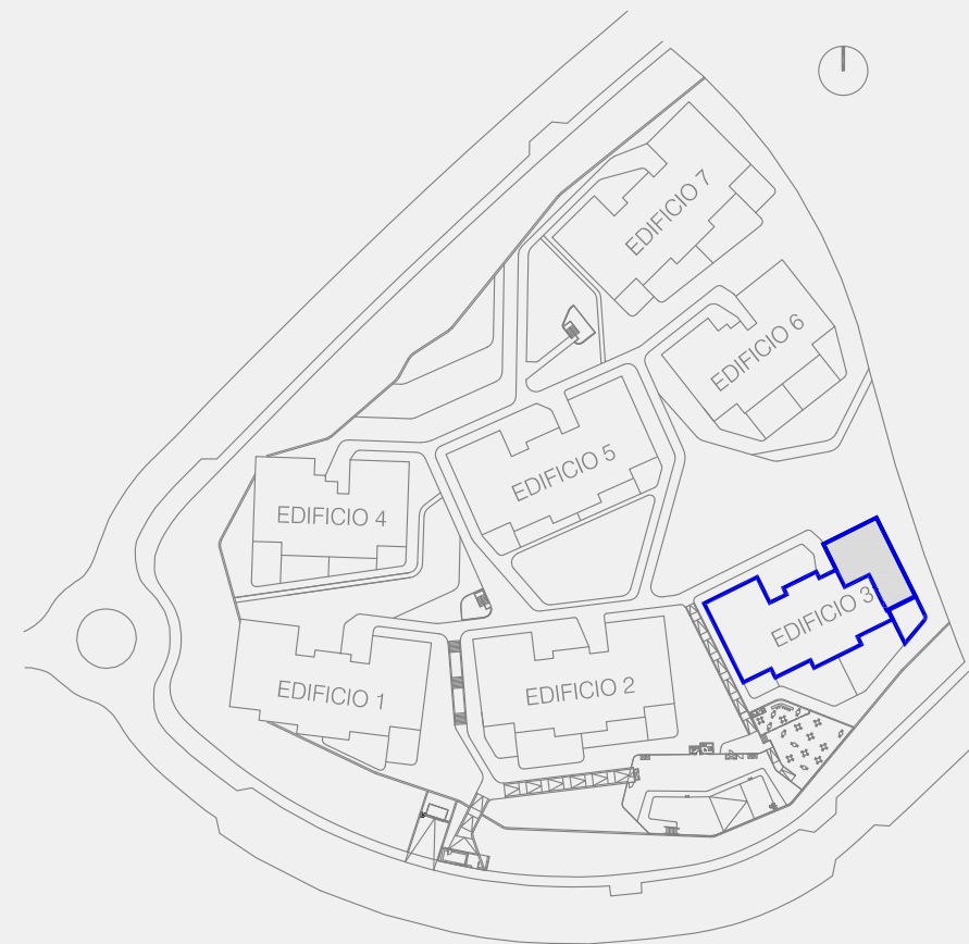
ESQUEMA ORDENACIÓN EDIFICIOS e: S/E