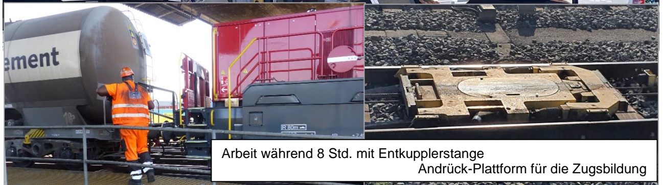
Arbeit während 8 Std. mit Entkuppelstange Andrück-Plattform für die Zugsbildung

Wir wünschen allen Mitgliedern frohe Festtage und einen guten Rutsch ins neue Jahr 2023