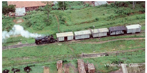
Vietnam – Einsatz vor Güterzug

Mit dem Verkauf 1947 an die Chemins de fer francais de l'Indochine gelang die Lokomotive zusammen mit drei Schwesterlokomotiven nach Vietnam (damals Indochina) und versah dort bis 1967, zum Schluss unter der Nr. VHX 31-201 den Dienst auf der 43 km langen Strecke Song Pha (früher Krong Pha)–Da Lat. Diese Strecke wies eine maximale Steigung von 120 Promille auf. Nach kriegsbedingten Unterbrüchen fanden 1975 die letzten Fahrten statt.