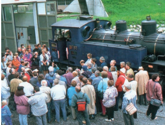
Realp – Inbetriebnahme 1993