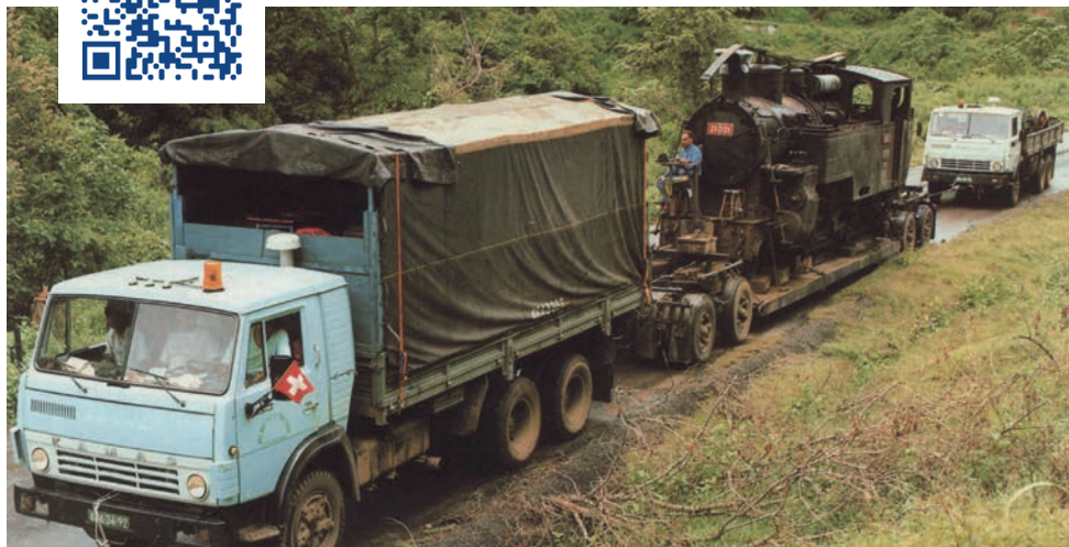
Vietnam – Back to Switzerland 1990