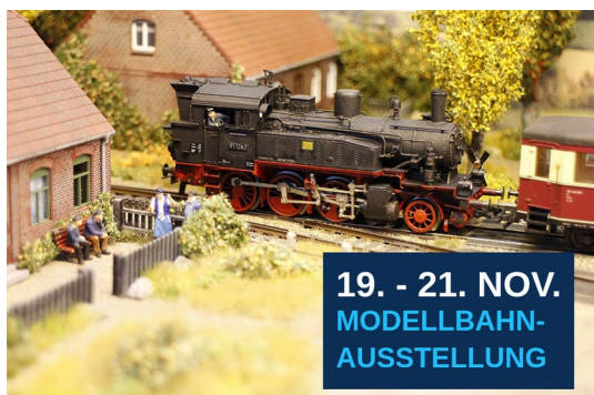
3. Modellbahnausstellung in Kühlungsborn