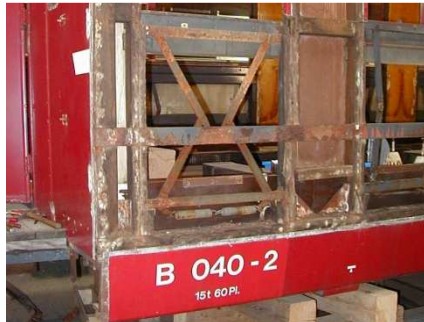
Die alte Nummer des B 4229, die er bei der LSE trug (ex Brünig C 829)