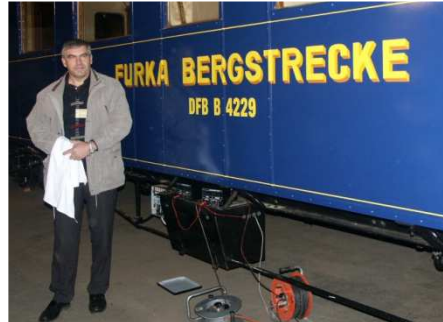
Der B 4229 mit seiner DFB-Bezeichnung bei der Waqentaufe

Die Wagenbezeichnungen setzen sich aus einem Typenschlüssel bestehend aus Buchstaben und einer Nummer zusammen. Die Typenbezeichnung – z.B. das B aus B 40 – ist genormt. Wenn ein Wagen von der DFB übernommen wird, wird sie deswegen beibehalten, sofern die Art des Wagens gleich bleibt.