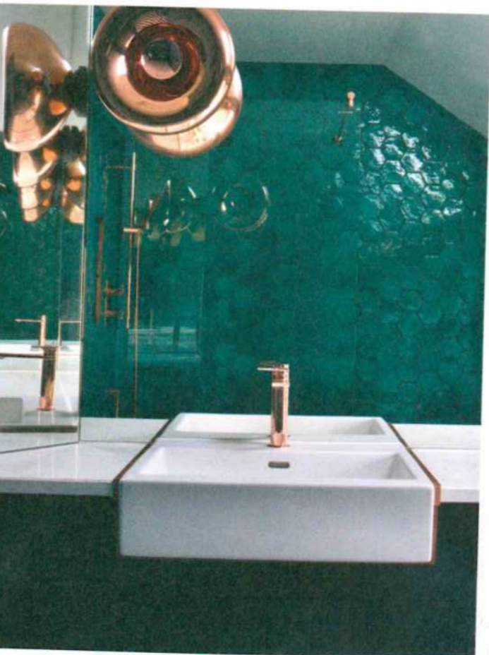
1. Dans la chambre principale, la tête de lit en rotin et noyer a été dessinée par KLD Design et fabriquée par Moore O'Gorman Joinery. Suspension de George Nelson trouvée sur nest.co.uk et table de nuit (West Elm). 2. La salle de bains principale met en scène des zelliges bleus, une vasque blanche avec un robinet en laiton (Versatile) et une applique au coloris or rose (Tom Dixon). 3. Au dernier étage, la chambre d'amis avec un lit (Made), une suspension (Out There Interiors) et un papier peint (Dimore Studio).