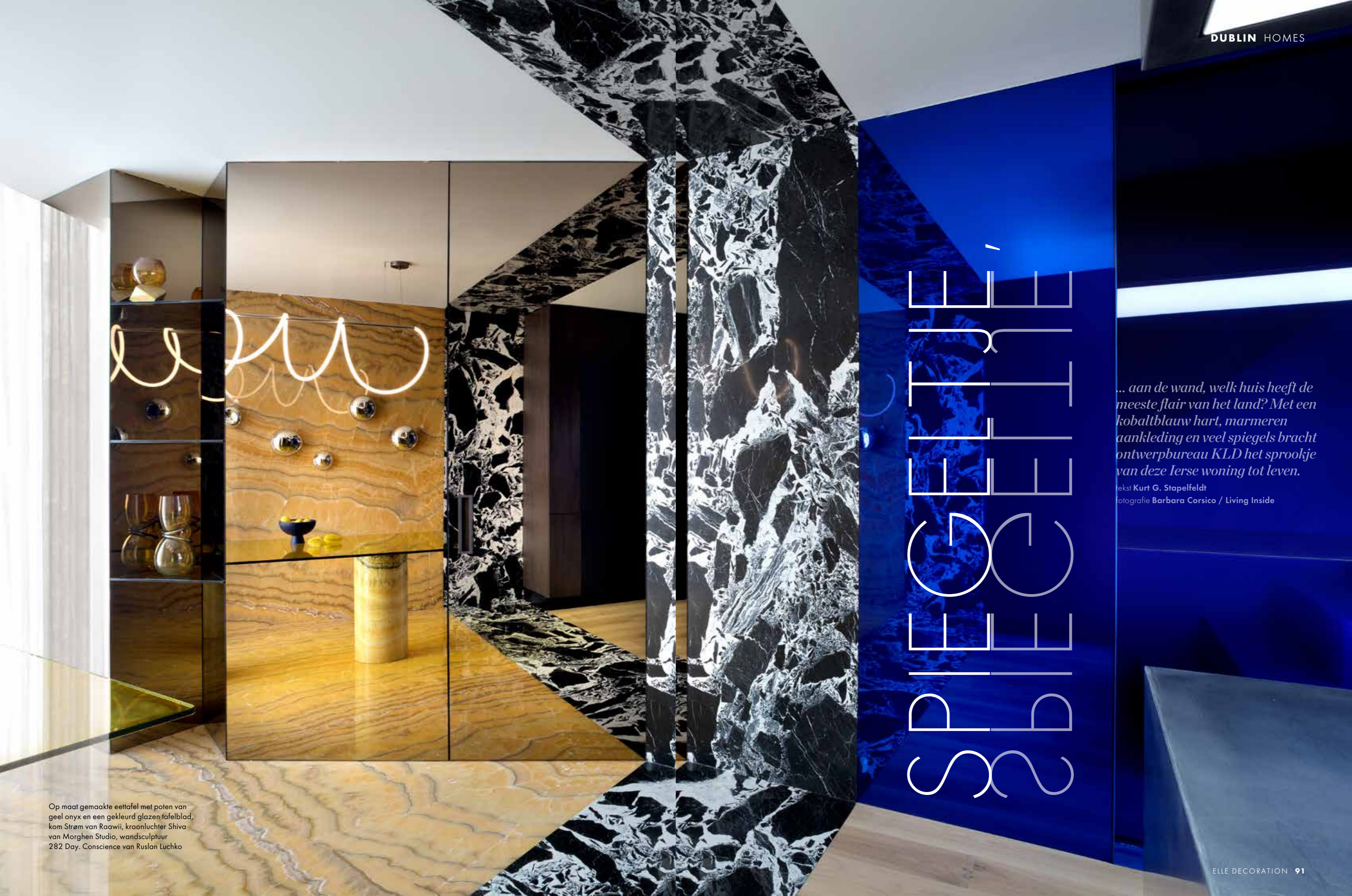
Op maat gemaakte eettafel met poten van geel onyx en een gekleurd glazen tafelblad, kom Strøm van Raawii, kroonluchter Shiva van Morghen Studio, wandsculptuur 282 Day, Conscience van Ruslan Luchko