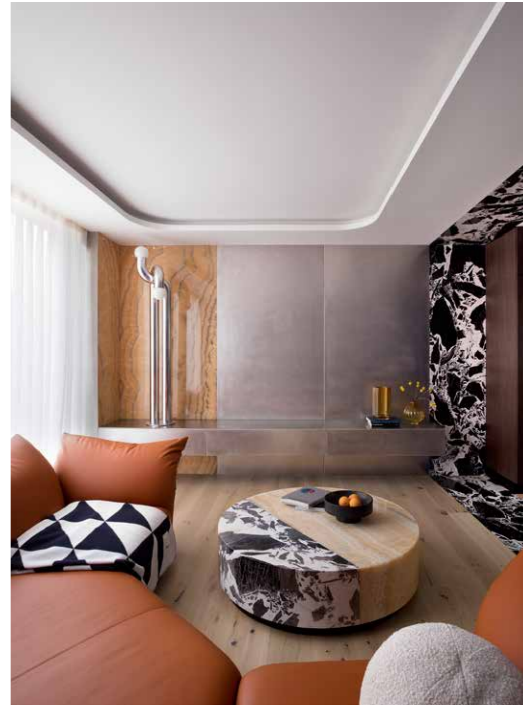
Op maat gemaakt wanddressoir en media-unit van geborsteld roestvrijstaal, bank van Edra, kussen Palla door Eichholtz, vloerlamp Modulation door Axel Chay, natuurstenen salontafel op maat gemaakt door KLD