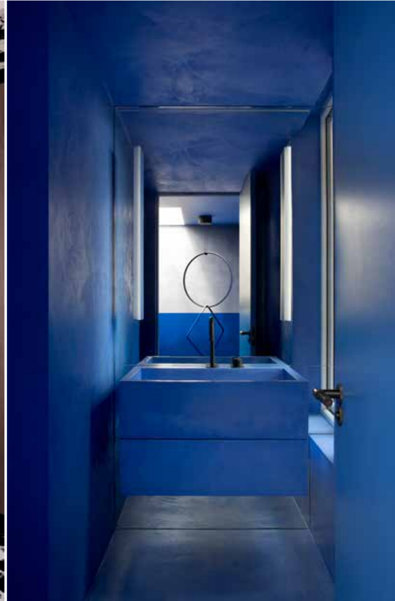
Linkerpagina In de badkamer is kobaltblauw microcement gebruikt Linksboven Aan de muur in de woonkamer hangt een geborsteld roestvrijstalen media-unit, op maat gemaakt door KLD Rechtsboven Hanglamp Arrangements van Flos