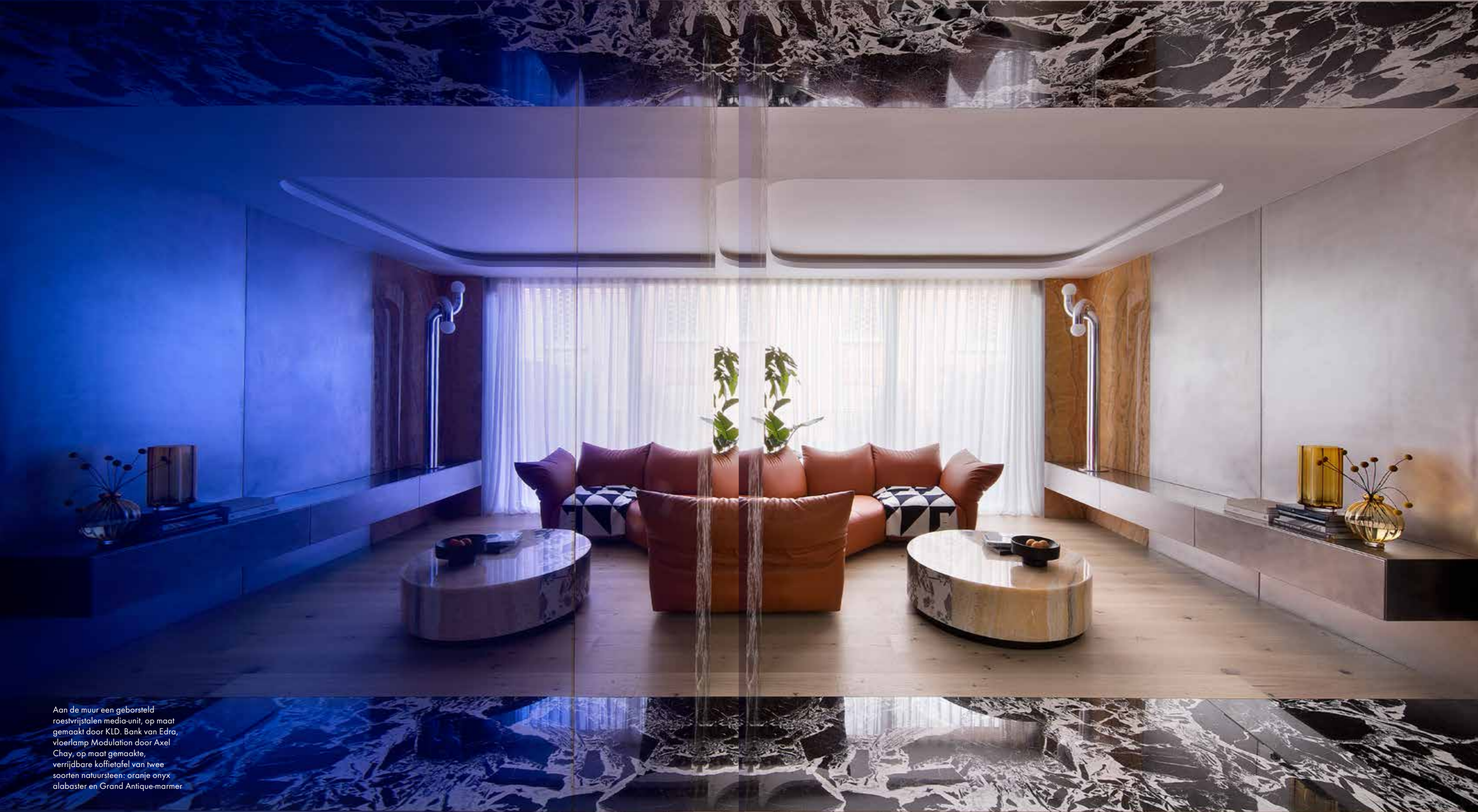
Aan de muur een geborsteld roestvrijstalen media-unit, op maat gemaakt door KLD. Bank van Edra, vloerlamp Modulation door Axel Chay, op maat gemaakte, verrijdbare koffietafel van twee soorten natuursteen: oranje onyx alabaster en Grand Antique-marmar