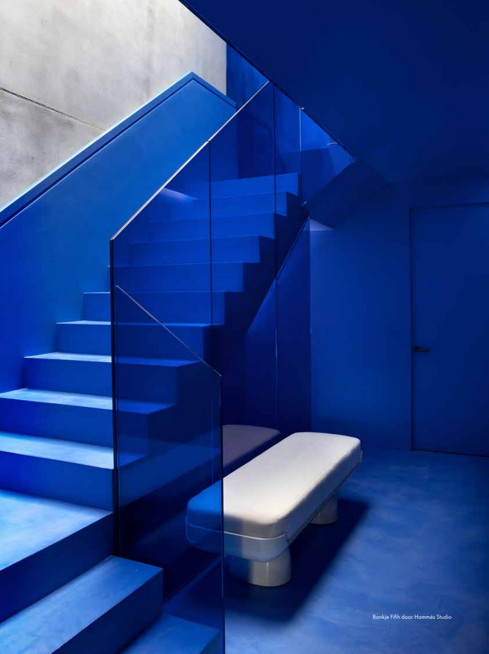
Bankje Fifih door Hommés Studio