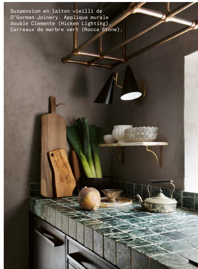
Suspension en laiton vieilli de O'Gorman Joinery. Applique murale double Clemente (Hicken Lighting). Carreaux de marbre vert (Rocca Stone).