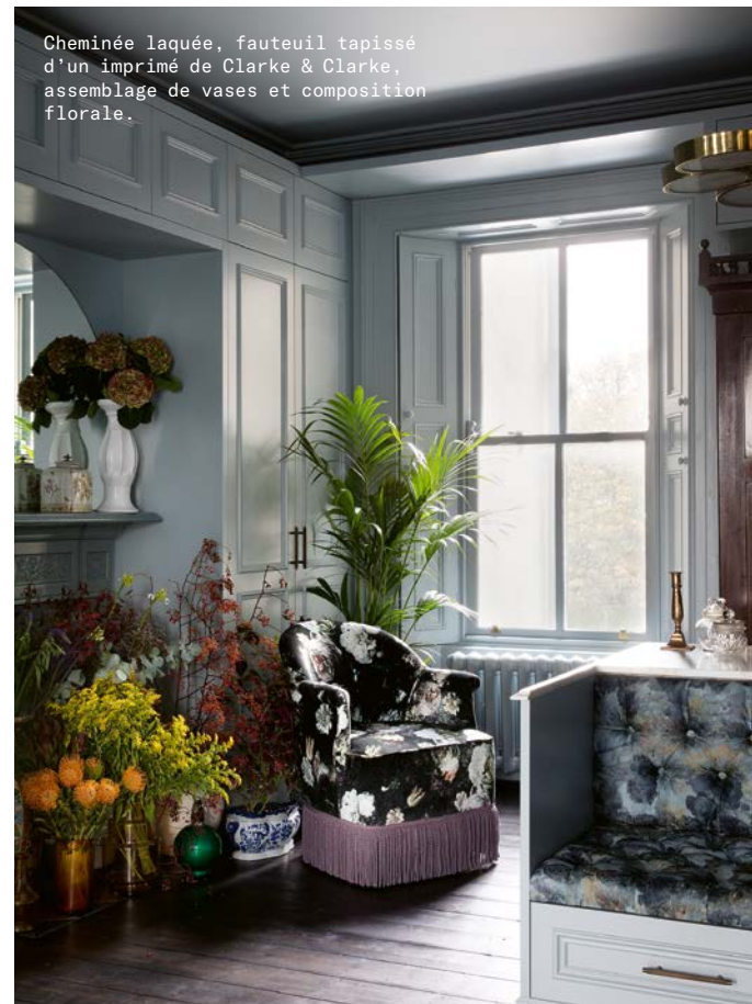
Cheminée laquée, fauteuil tapissé d'un imprimé de Clarke & Clarke, assemblage de vases et composition florale.