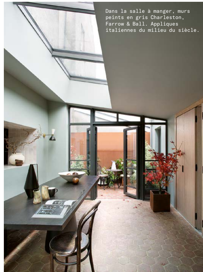
Dans la salle à manger, murs peints en gris Charleston, Farrow & Ball. Appliques italiennes du milieu du siècle.