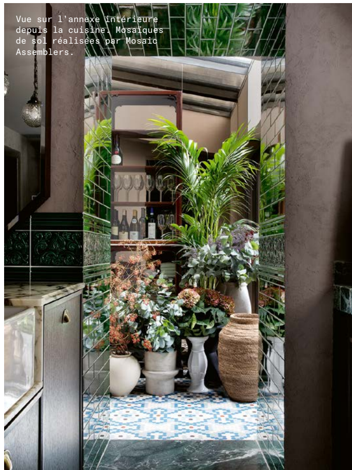
Vue sur l'annexe intérieure depuis la cuisine. Mosaïques de sol réalisées par Mosaic Assemblers.