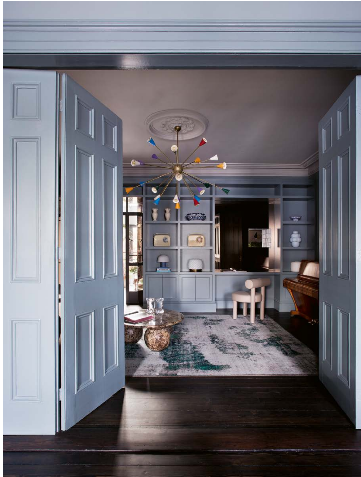
Dans la salle de lecture, menuiserie murale sur mesure avec bureau intégré réalisée par O'Gorman Joinery. Tapis persan vintage (Irugs). Chaise Gropius CS1 de Noom Home. Vases de Nordic Elements.