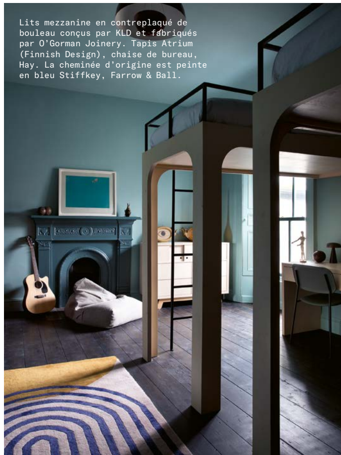
Lits mezzanine en contreplaqué de bouleau conçus par KLD et fabriqués par O'Gorman Joinery. Tapis Atrium (Finnish Design), chaise de bureau, Hay. La cheminée d'origine est peinte en bleu Stiffkey, Farrow & Ball.