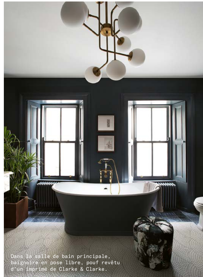
Dans la salle de bain principale, baignoire en pose libre, pouf revêtu d'un imprimé de Clarke & Clarke.