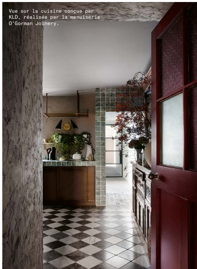
Vue sur la cuisine conçue par KLD, réalisée par la menuiserie O'Gorman Joinery.